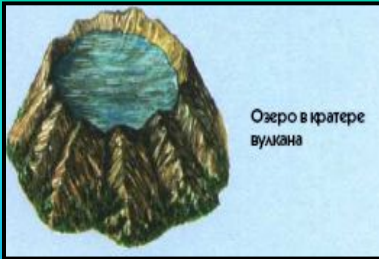
Озеро в кратере вулкана

Озёрными котловинами могут стать кратеры потухших вулканов, а иногда и понижения на поверхности лавовых потоков. Такие озёра, называемые вулканическими , встречаются, например, на Курильских и Японских островах, на Камчатке, на острове Ява и в других вулканических районах Земли.