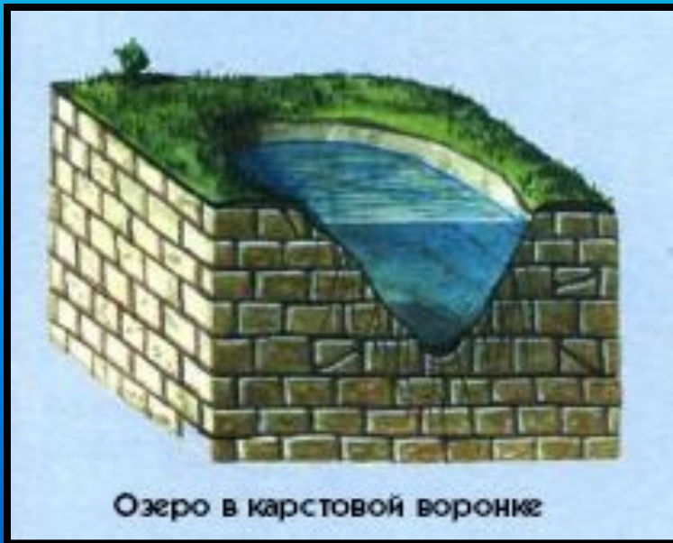
Озеро в карстовой воронке

Озёрными котловинами могут стать кратеры потухших вулканов, а иногда и понижения на поверхности лавовых потоков. Такие озёра, называемые вулканическими , встречаются, например, на Курильских и Японских островах, на Камчатке, на острове Ява и в других вулканических районах Земли.