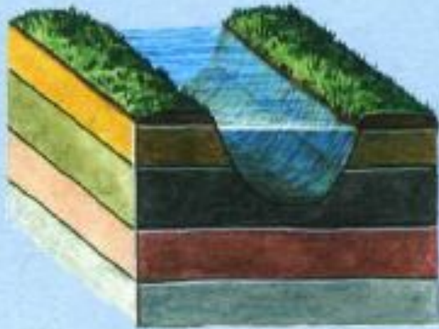
Озеро в борозде, выпаханной ледником