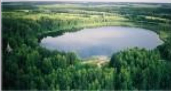
Озеро Саяглар – жемчужина России