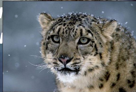
снежный леопард (барс)

Из хищников в горах встречаются леопард, ирбис, снежный барс, бурый медведь, лисица, заяц, енот-полоскун, белогрудый хорь.