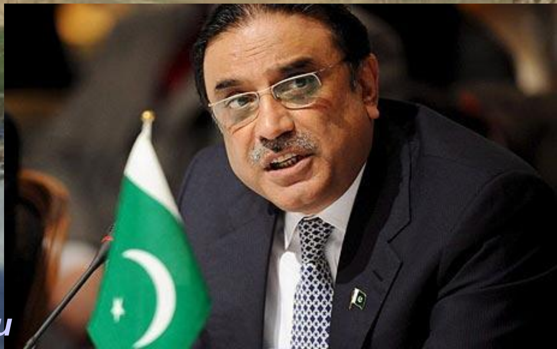
Асиф Али Зардари