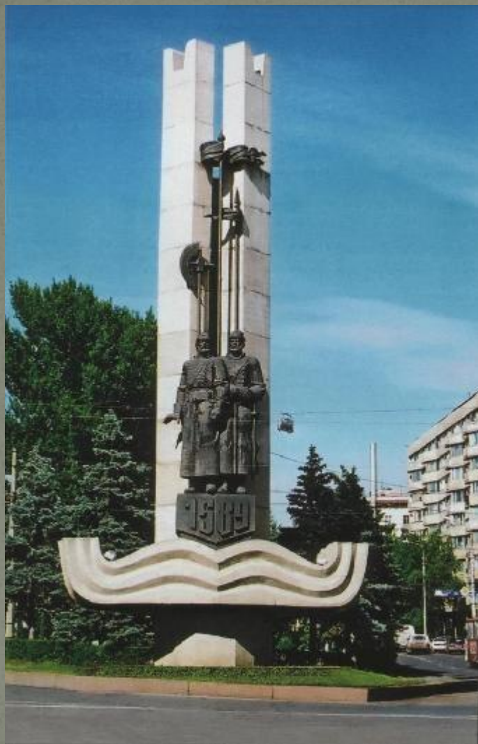
Памятник в честь основания Царицына