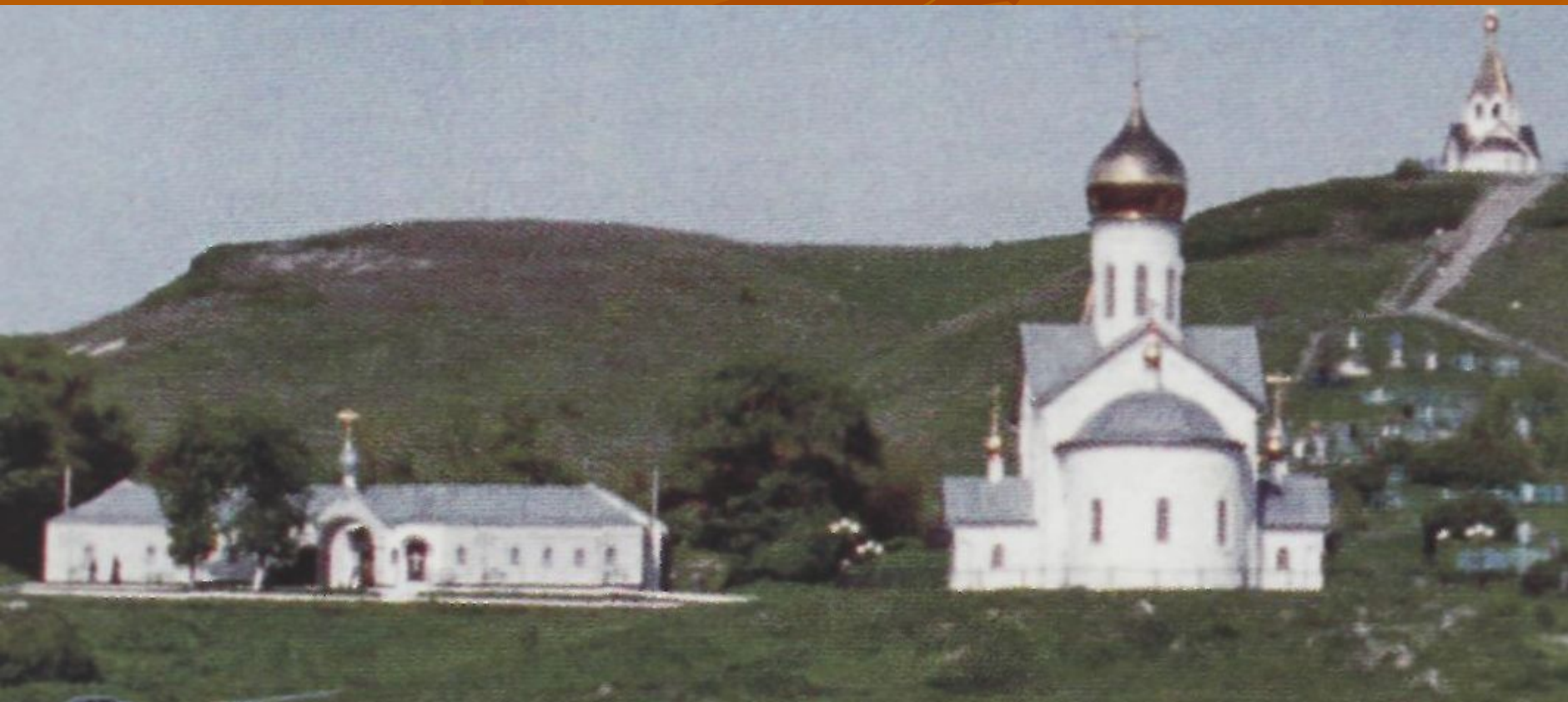
Троицкий Спасо-Преображенский музей-монастырь в с.Холки Чернянского района