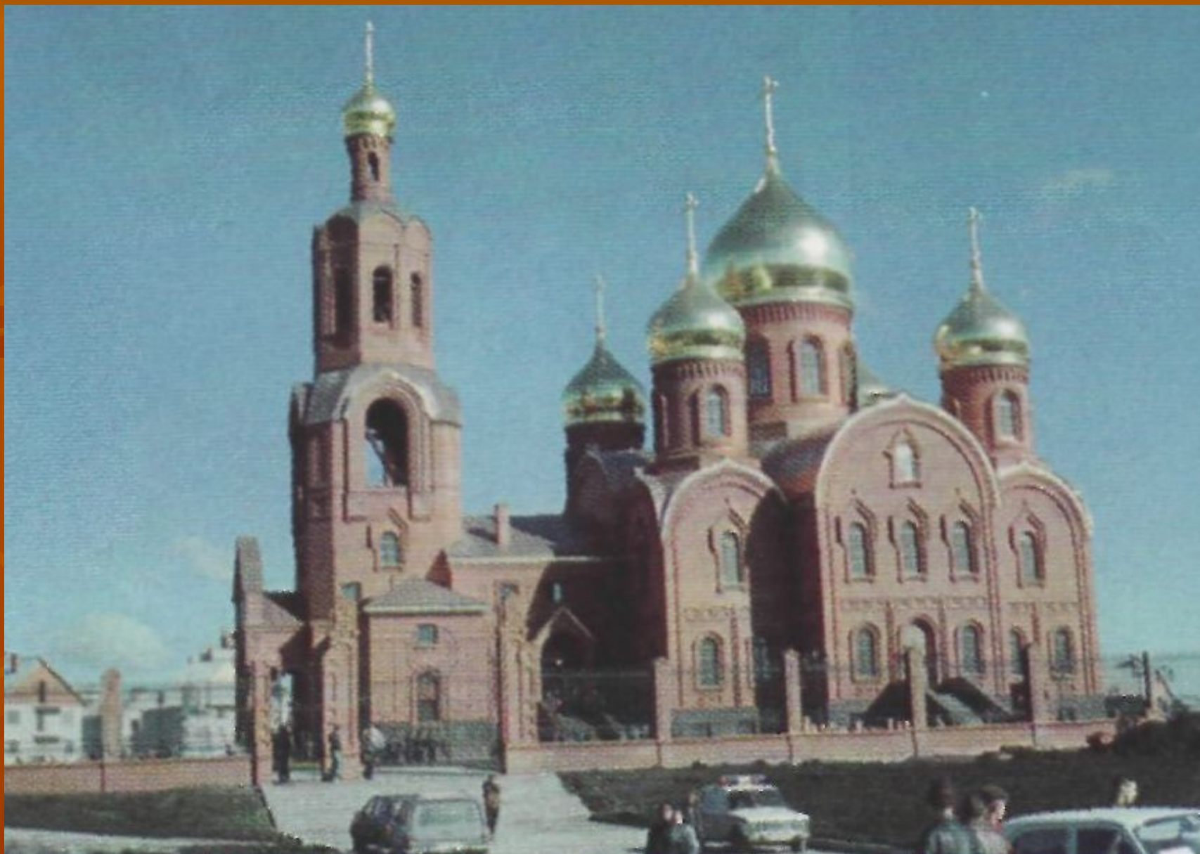
Спасо-Преображенский собор в Губкине