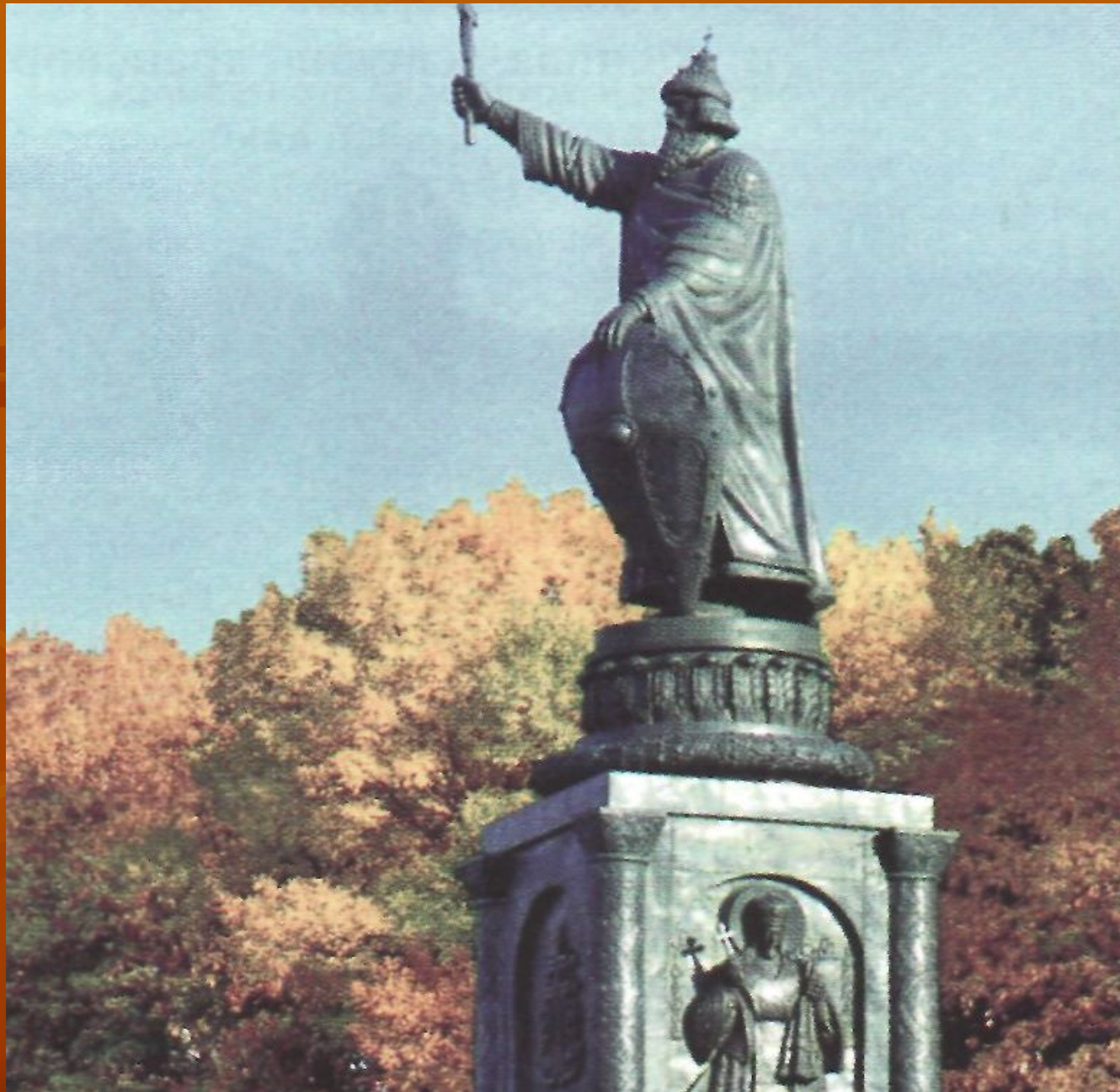
Памятник князю Владимиру в Белгороде