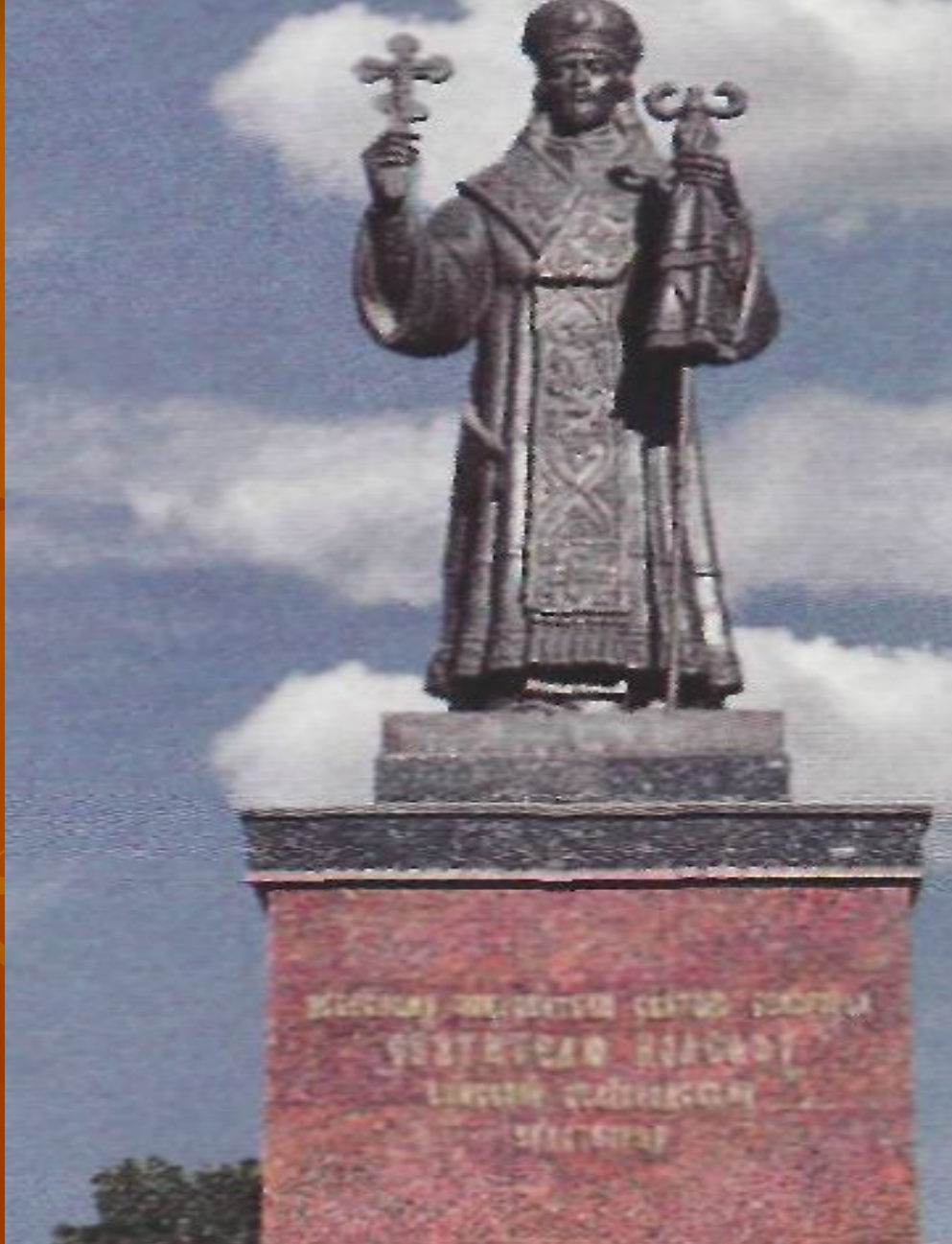
Памятник Святителю Иоасафу Белгородскому