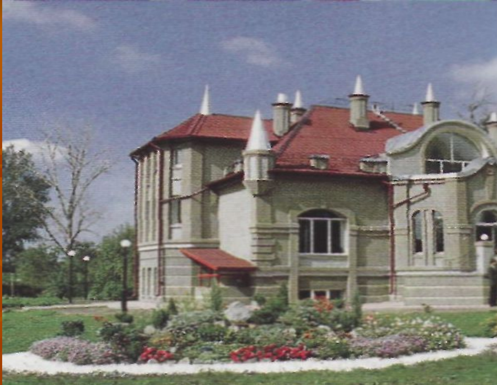
Духовно-просветительский центр во имя святителя Иоасафа Белгородского в Грайвороне