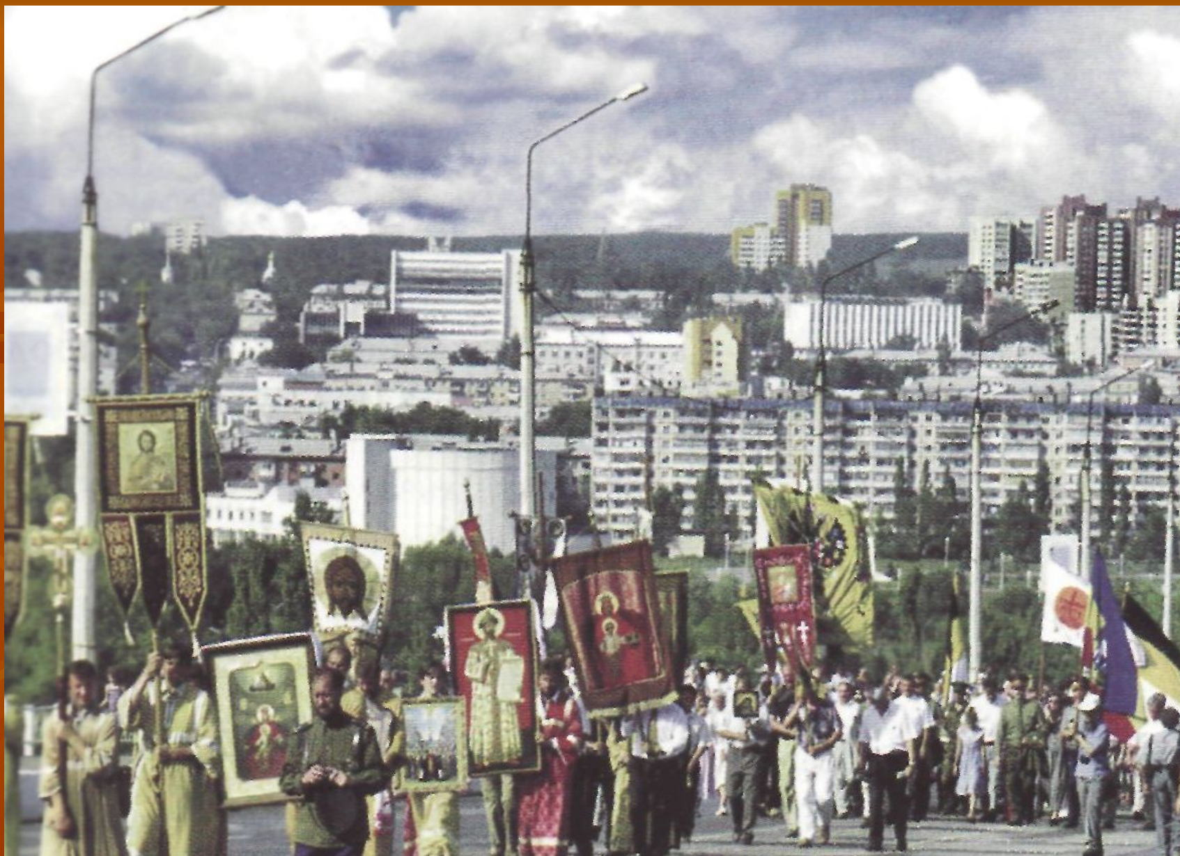
Крестный ход в Белгороде