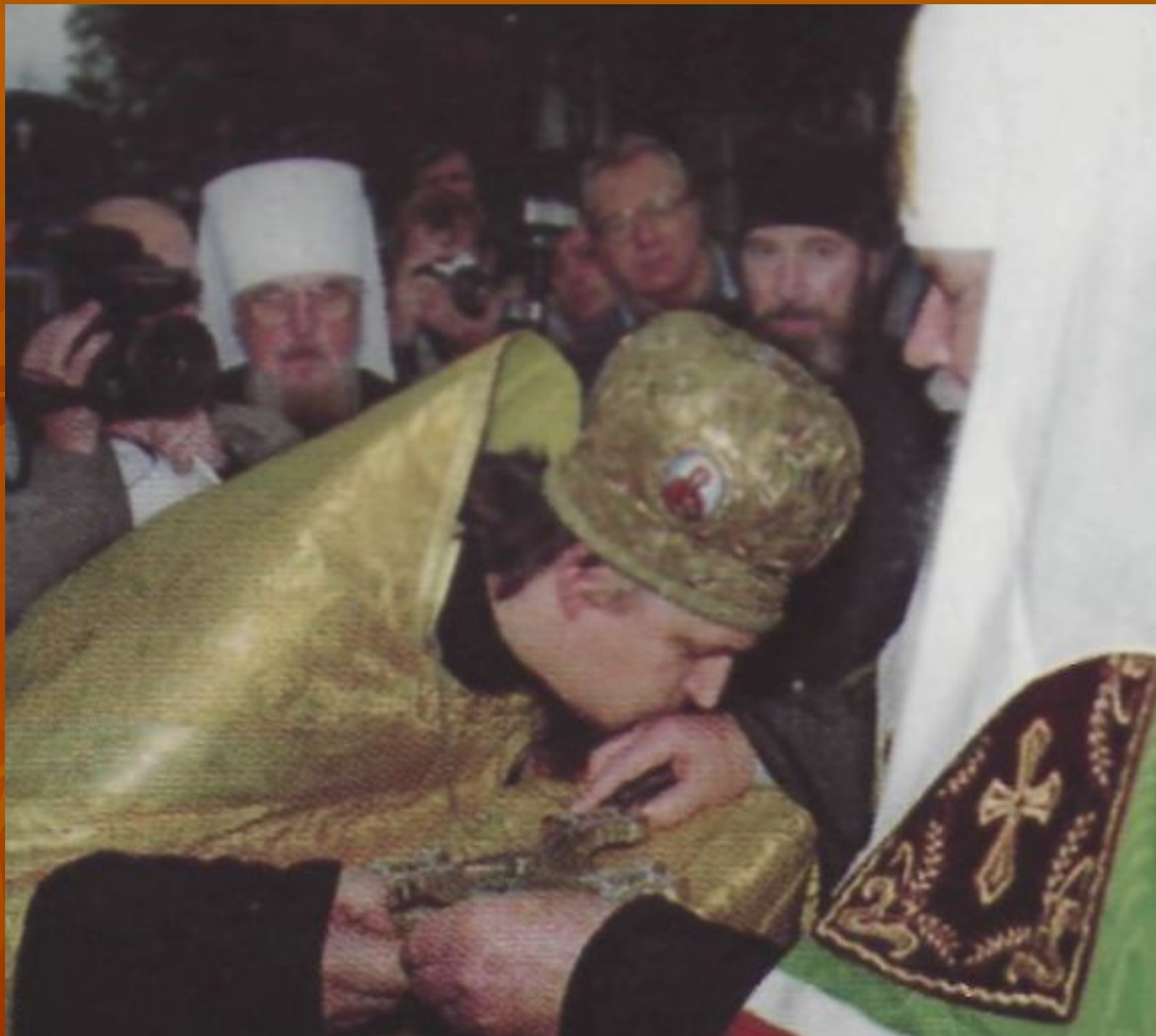
Патриарх Алексий II в Белгороде