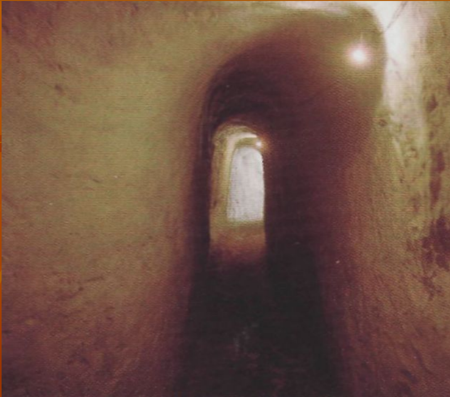
Фрагмент Холковских пещер