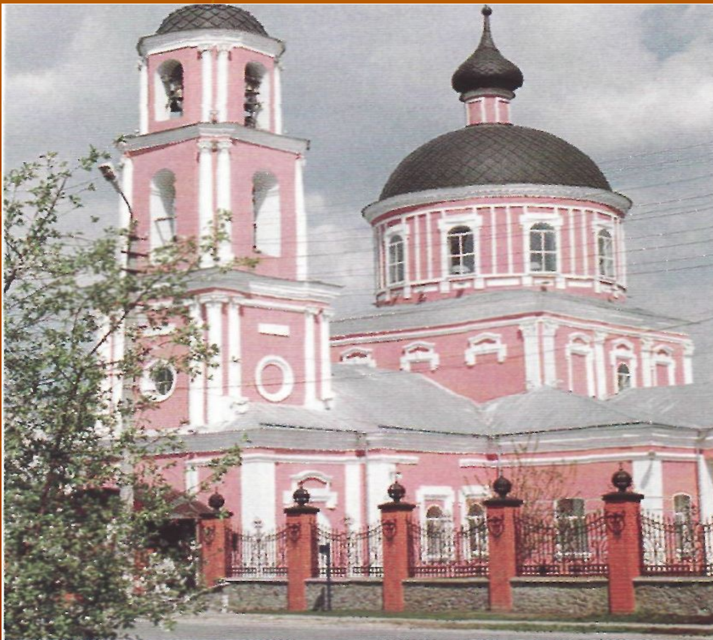
Храм Воздвижения креста Господня в Старом Осколе