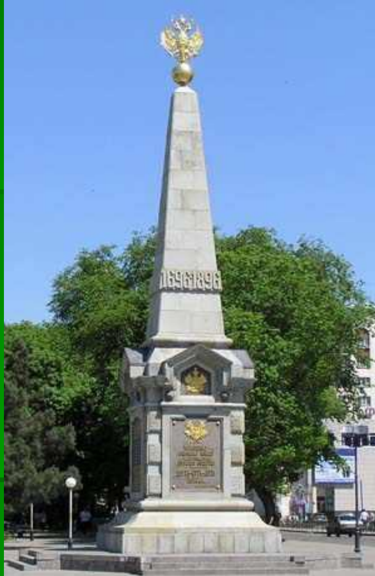
Памятник в честь 200-летия Кубанского казачьего войска, 1897 г.(восстановлен в 1999 г.), архитектор В.А.Филиппов, автор восстонов. пам. А.А.Аполлонов. Находится на пересечении ул.Красной и ул. Буденного