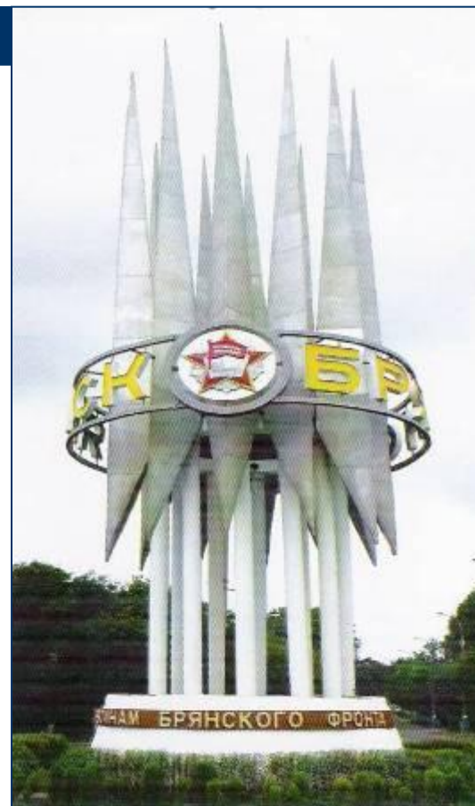
Памятный знак воинам Брянского фронта

Освобождение районов Брянщины от немецко-фашистских захватчиков началось 12 августа и полностью завершилось 29 сентября 1943 года. При активной поддержке партизан войска трех фронтов - Брянского, Западного и Центрального нанесли тяжелое поражение соединениям противника. Более трех четвертей территории современной Брянщины освободили войска Брянского фронта. В 1981 году в областном центре, в районе железнодорожного вокзала установлен памятный знак воинам Брянского фронта.