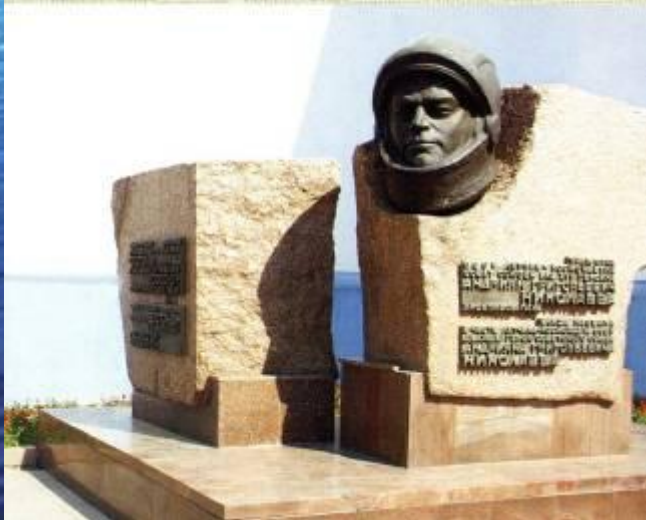
Памятник А.Г. Николаеву