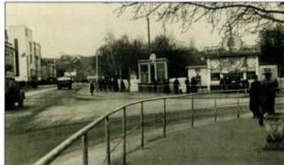
Вход в парк им. Н. К. Крупской, 1955 г.