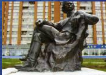
Памятник А.М. Горькому