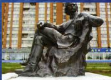
Памятник А.М. Горькому