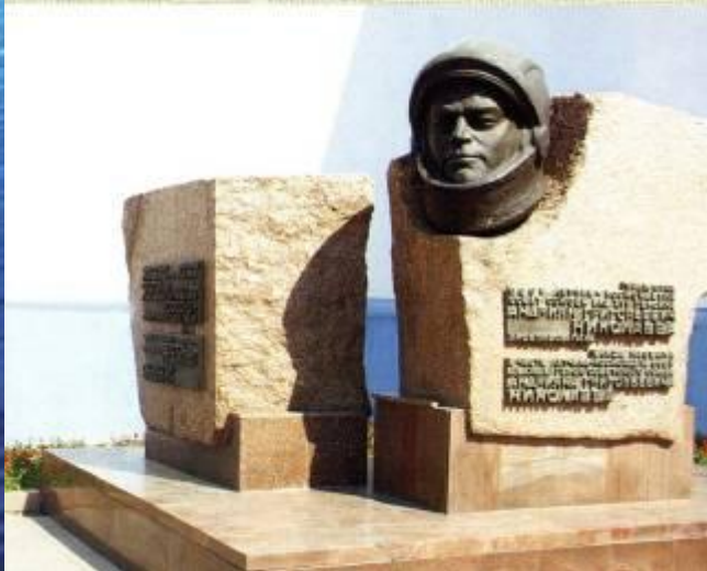
Памятник А.Г. Николаеву