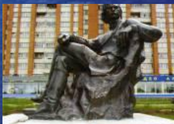
Памятник А.М. Горькому