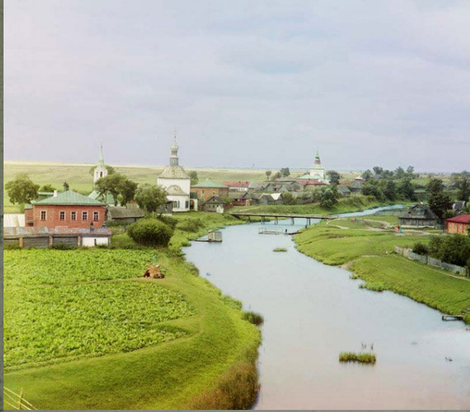
Вид Суздаля по реке Каменке Фотография С.М.Прокудина-Горского.

Архитектурное богатство Российской Империи отражало ее многовековую историю и культурное, этническое и религиозное разнообразие ее народов. Прокудин-Горский запечатлел средневековые церкви и монастыри Европейской России, а также мечети и мусульманские школы на Кавказе и в Средней Азии. Многие из зданий на его фотографиях позднее были разрушены во время войны или революции, но некоторые из них пережили Советский период и были реставрированы. Кроме религиозных зданий Прокудин-Горский фотографировал дома, загородные поместья, фабрики и амбары. Его мастерство как фотографа и техническая продуманность его методов очевидны в выборе предметов изображения, начиная от церковных интерьеров и кончая панорамными видами городов.