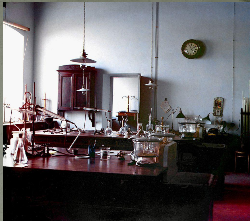
Фотолаборатория Прокудина-Горского на Большой Подъяческой 22 в Петербурге

2 августа 1901 года в Петербурге на Большой Подъяческой 22 открывается «фотоцинкографическая и фототехническая мастерская» С.М. Прокудина-Горского. Именно здесь у Прокудина-Горского наконец-то появляется своя химическая «испытательная», как он назовет ее позже, лаборатория, здесь с 1906 по 1909 годы будет расположена редакция журнала «Фотограф-Любитель», в течение 10 лет в этом же доме на Большой Подъяческой будет жить и семья Прокудиных-Горских.