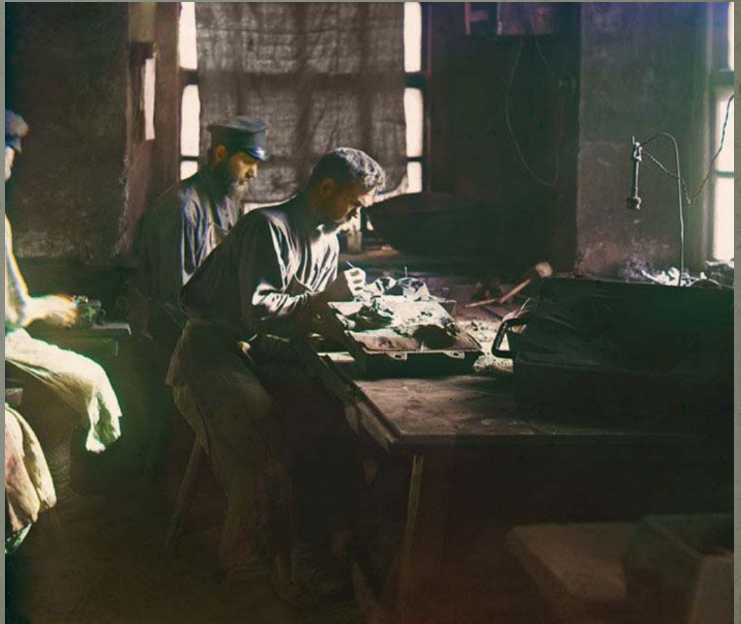
Сергей Михайлович Прокудин-Горский. Формовка художественного литья, 1910. Цифровое цветное изображение. (31)

Основанный в 1747 году, литейный завод Касли расположен на Урале, между Екатеринбургом и Челябинском, в районе, богатом железной рудой. Завод был известен высококачественным литьем и высококвалифицированной рабочей силой, которая составляла более трех тысяч человек в то время, когда была сделана эта фотография.