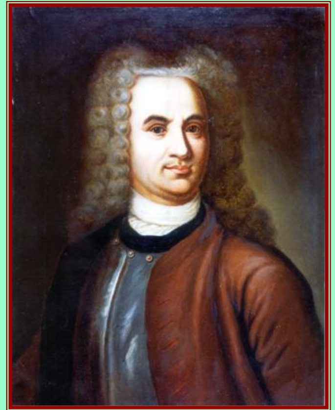
Татищев В.Н. 1686 - 1750

Удачную точку на карте Урала нашёл капитан артиллерии Василий Никитич Татищев для строительства Егошихинского завода. А на месте этого завода вырос один из крупнейших городов Урала.