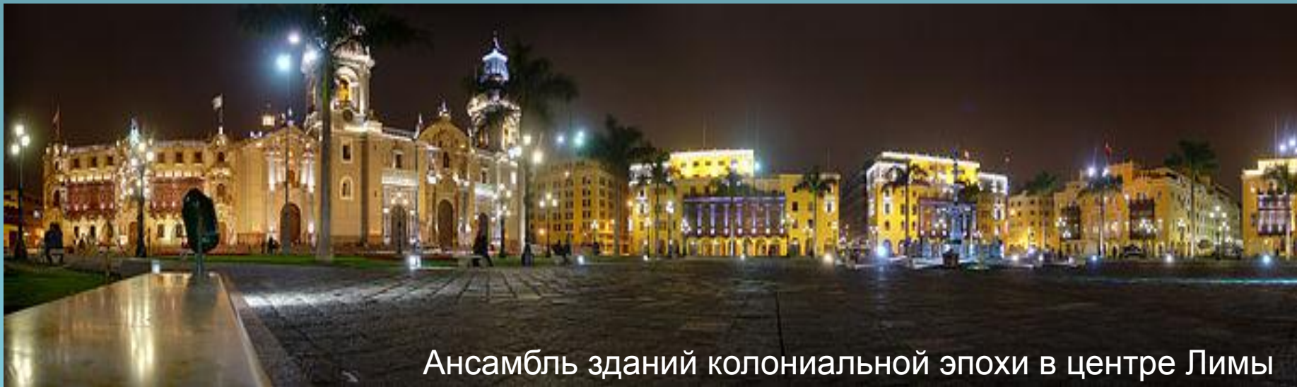
Ансамбль зданий колониальной эпохи в центре Лимы