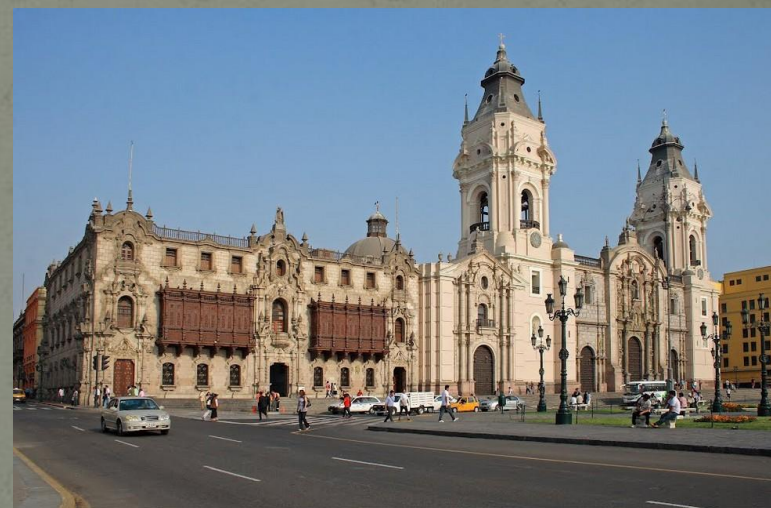
Кафедральный собор (усыпальница Писарро)