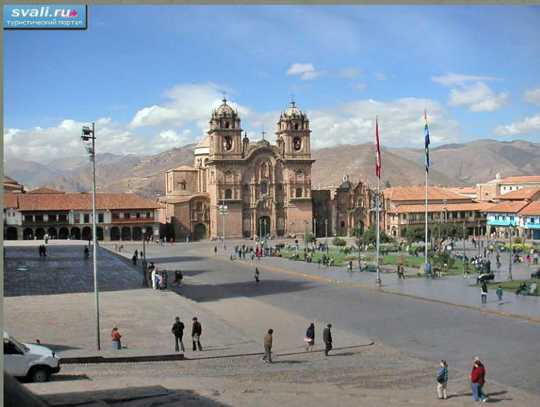
площадь Пласа-де Армас