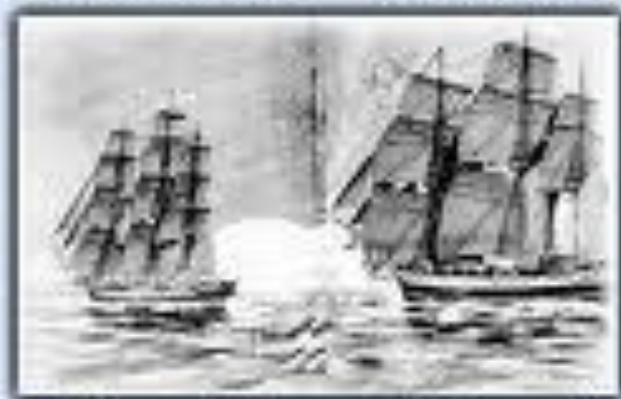
Шлюпы Восток и Мирный