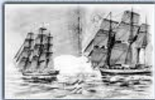
Шлюпы Восток и Мирный