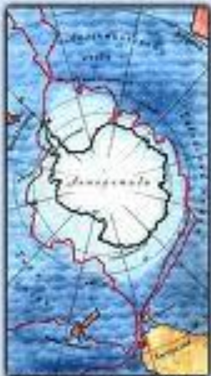
Русская экспедиция в Антарктику в 1819-1821 гг.