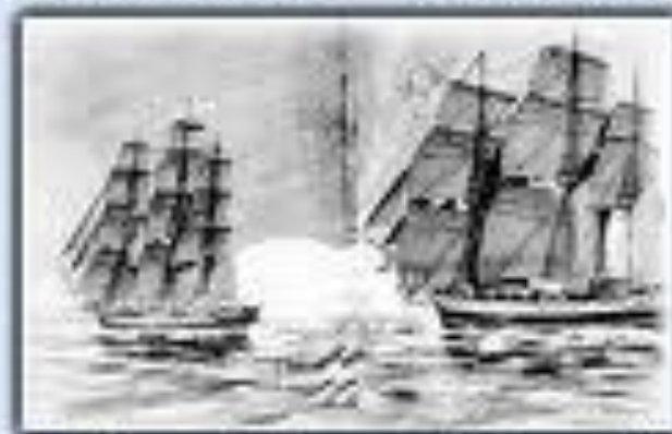
Шлюпы Восток и Мирный