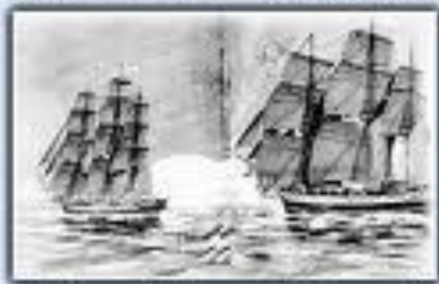
Шлюпы Восток и Мирный