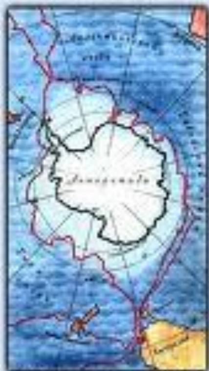
Русская экспедиция в Антарктику в 1819-1821 гг.