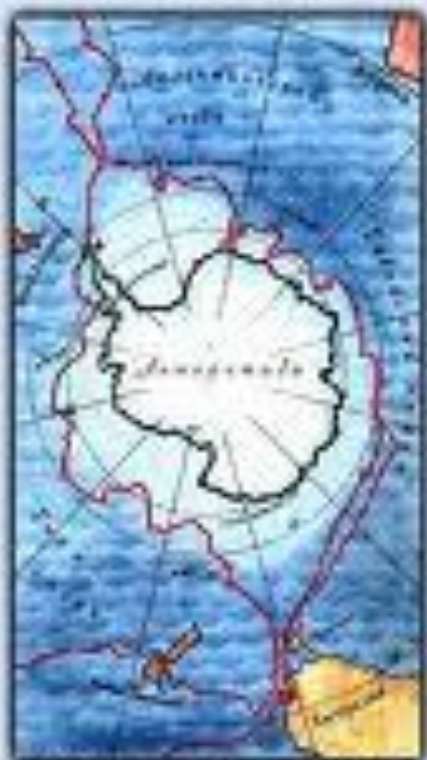
Русская экспедиция в Антарктику в 1819-1821 гг.