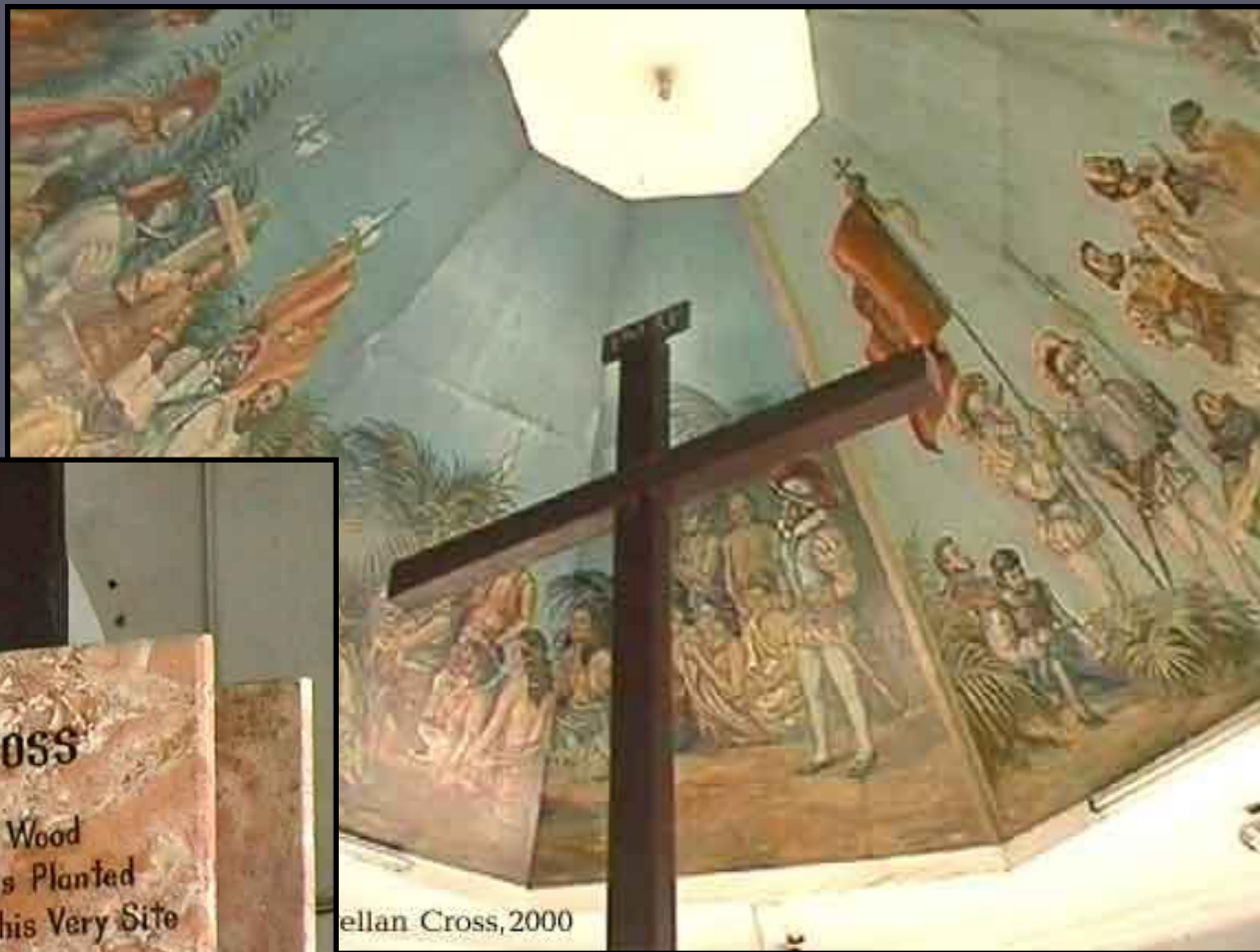
Magellan Cross, 2000