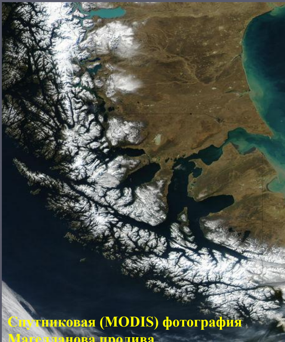
Спутниковая (MODIS) фотография Магелланова пролива