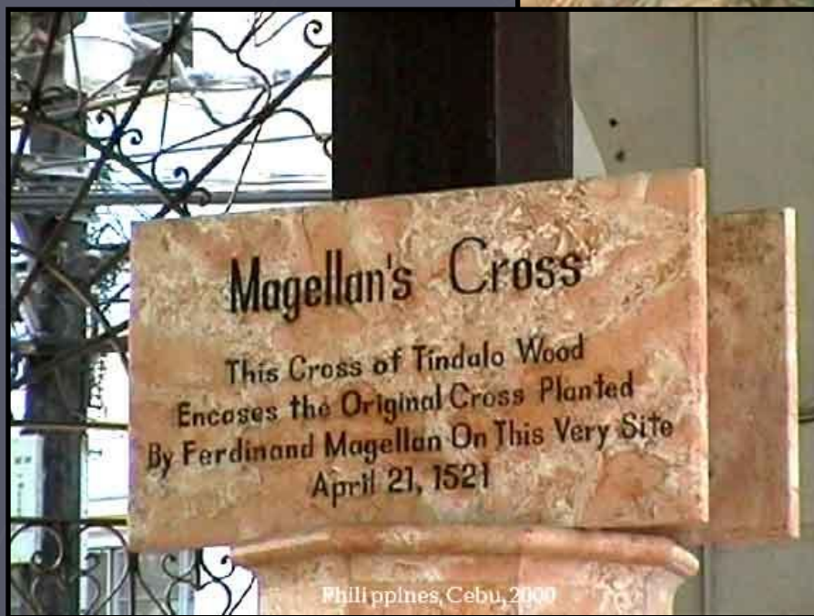
Philippines, Cebu, 2000