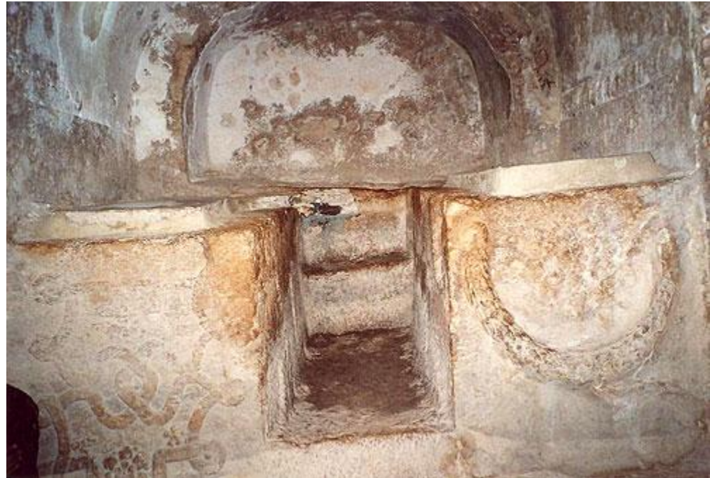
Пещера семи спящих отроков