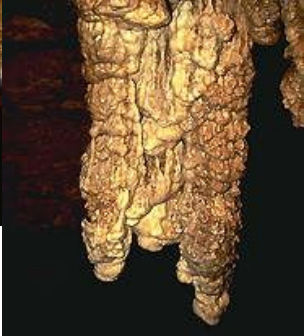
Сталактиты в пещерах Техаса.