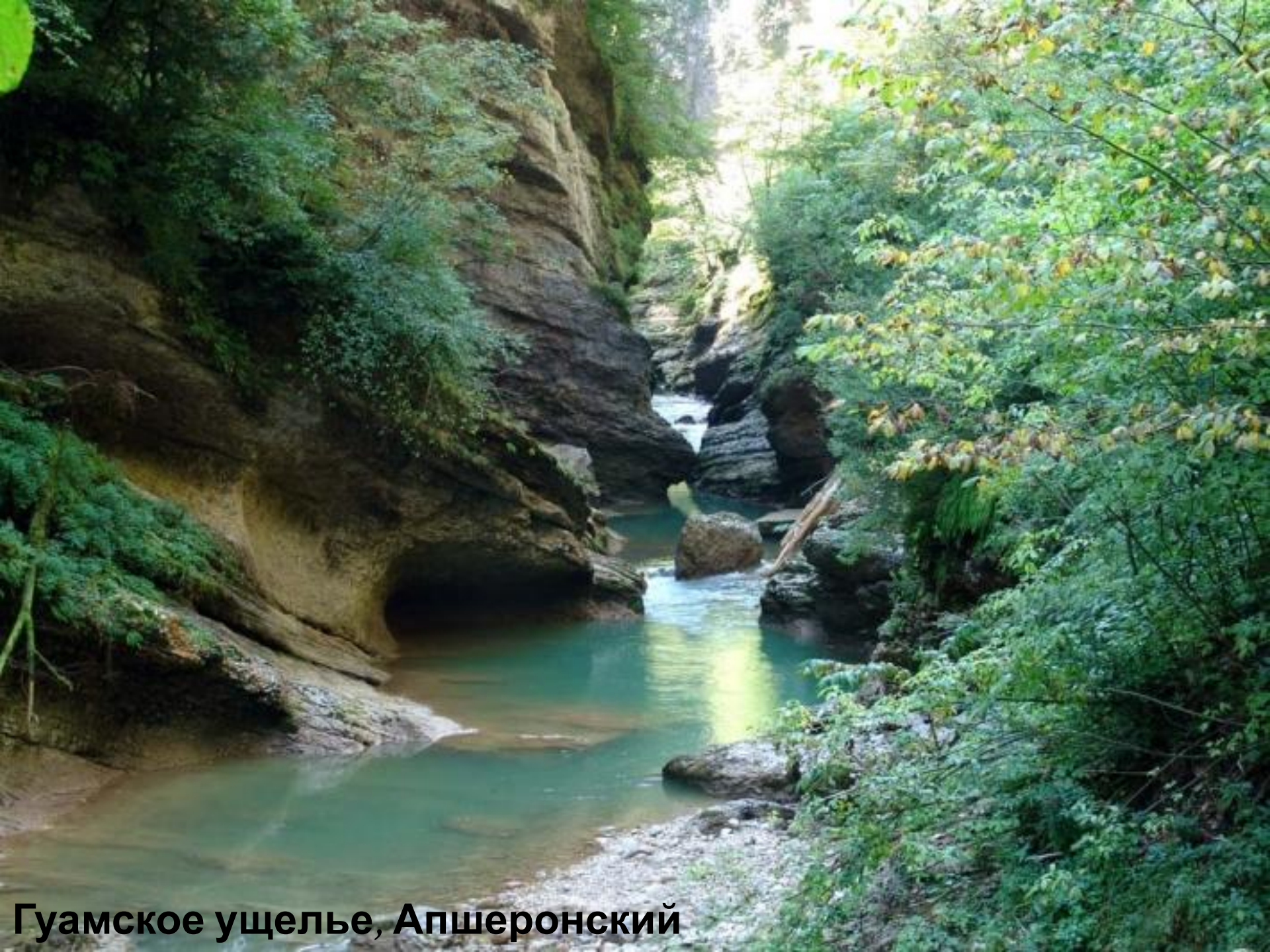
Гуамское ущелье, Апшеронский