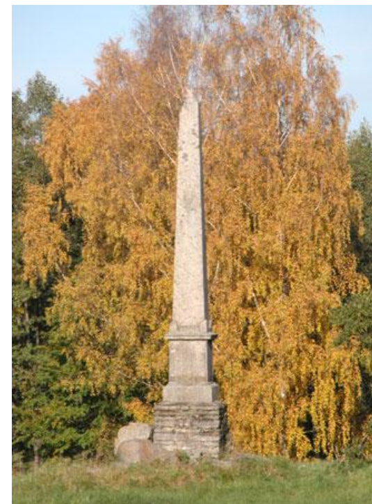
Памятник строителям Петергофа