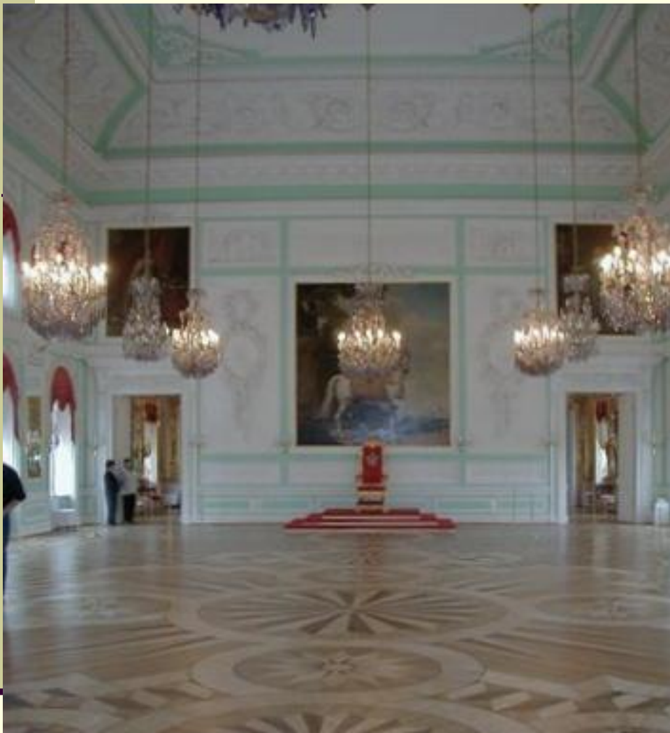
Тронный зал (самый большой (330 кв. м.) и наиболее торжественный зал дворца )