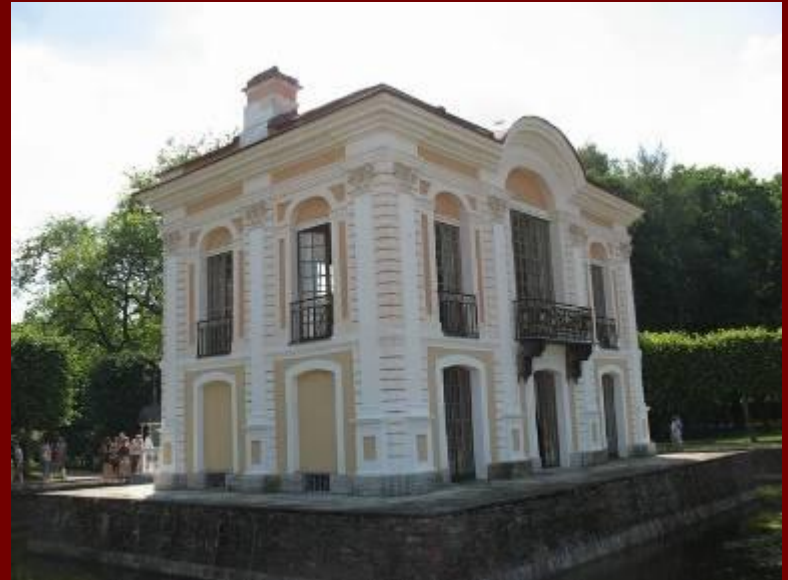
Павильон Эрмитаж «Приют отшельника», «Уединенный уголок»