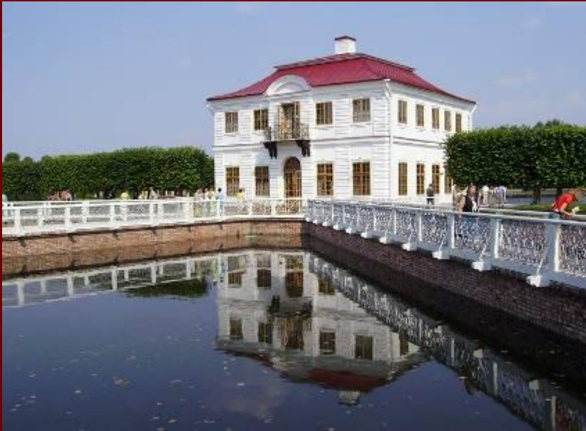
Дворец Марли Малые приморские палаты