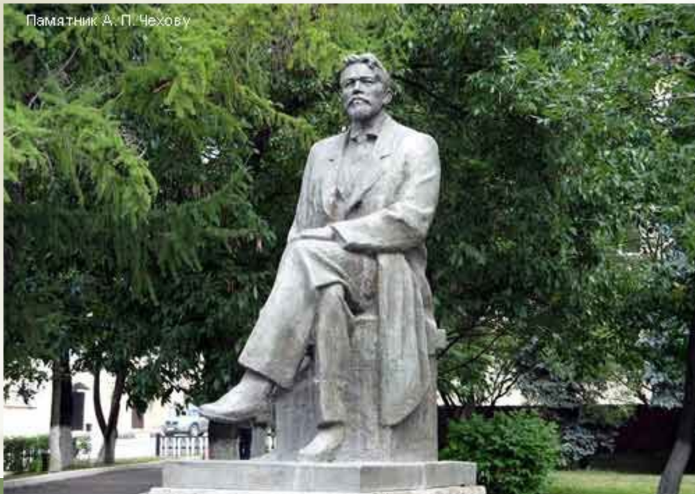
Памятник А. П. Чехову