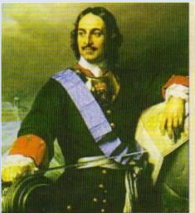
Pierre I er (1672-1725)