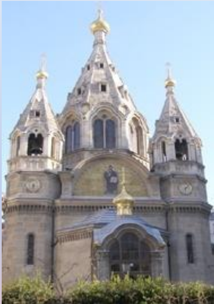
La cathedrale d'Alexandre Nevski Православный собор Александра Невского