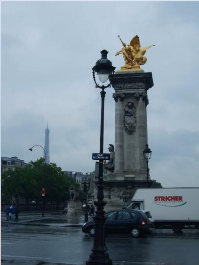
Мост Александра Pont d'Alexandre III