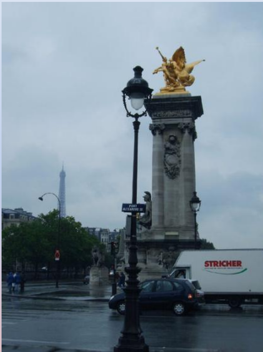
Мост Александра Pont d'Alexandre III