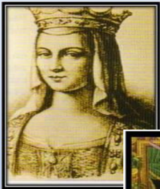
Anne de Kiev Анна Ярославна