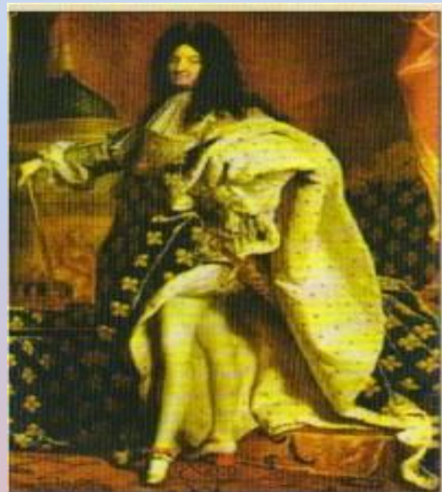
Louis XIV (1638-1715)