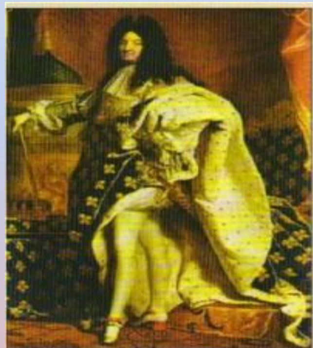
Louis XIV (1638-1715)