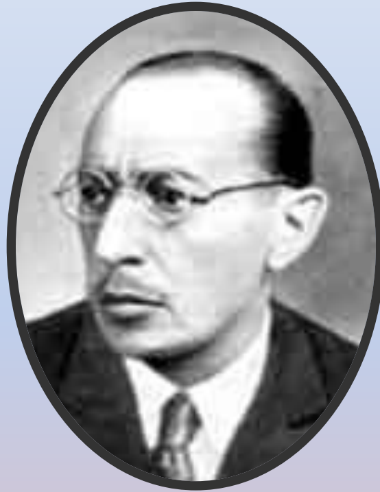
Igor Stravinski. Игорь Стравинский (1882-1971)