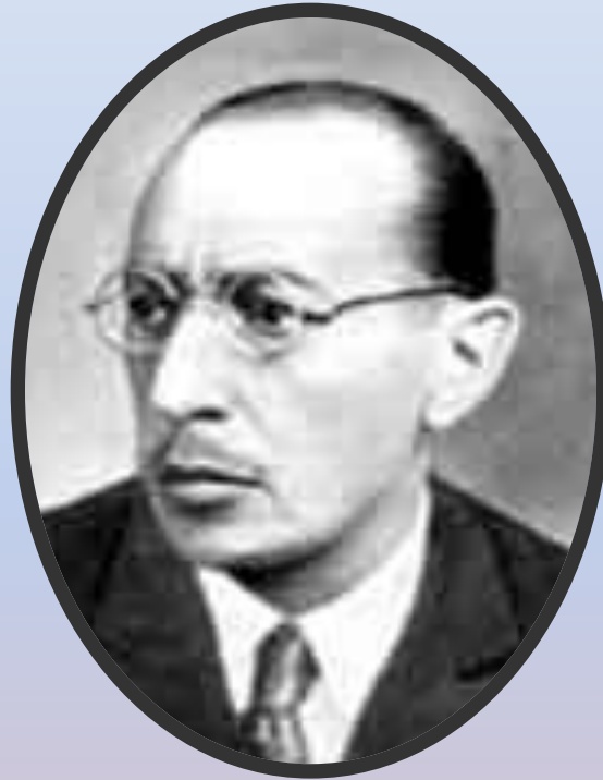
Igor Stravinski. Игорь Стравинский (1882-1971)