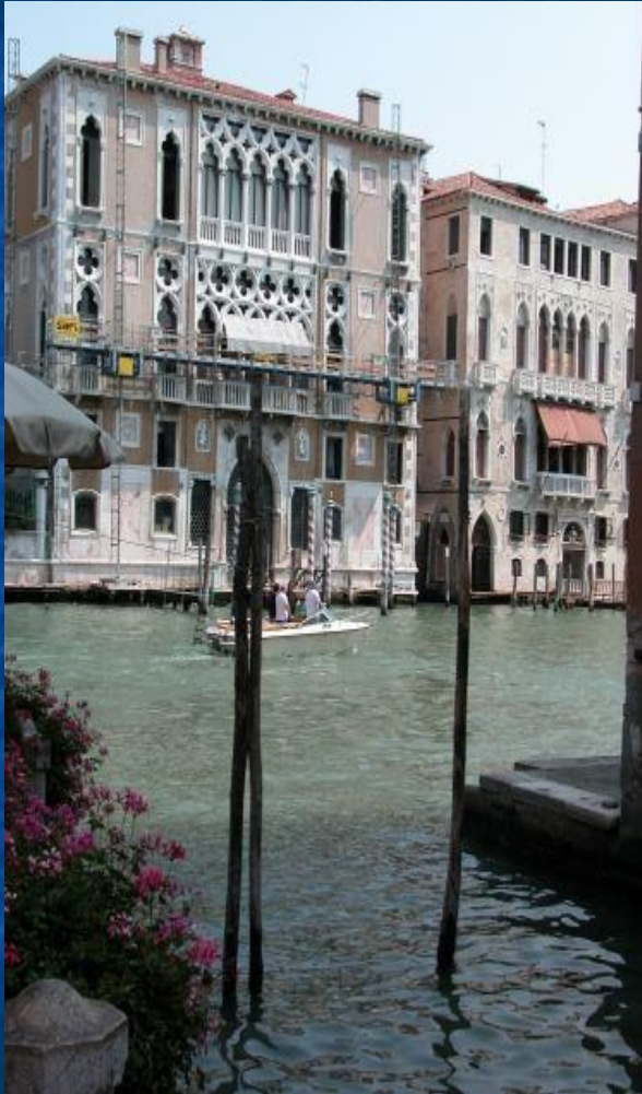
Венеция. Большой канал

Побывав в этом чудесном городе, мы поняли, что Санкт-Петербург называют «Северной Венецией» не только из-за внешнего сходства их архитектурных памятников и ансамблей, но и из-за удивительной схожести атмосферы, царящей в этих всемирно известных городах. Питер, как и Венеция, расположен на огромном количестве каналов. И как по каналам Венеции плавают гондолы, так по каналам Петербурга путешествуют прогулочные катера с туристами и отдыхающими горожанами.