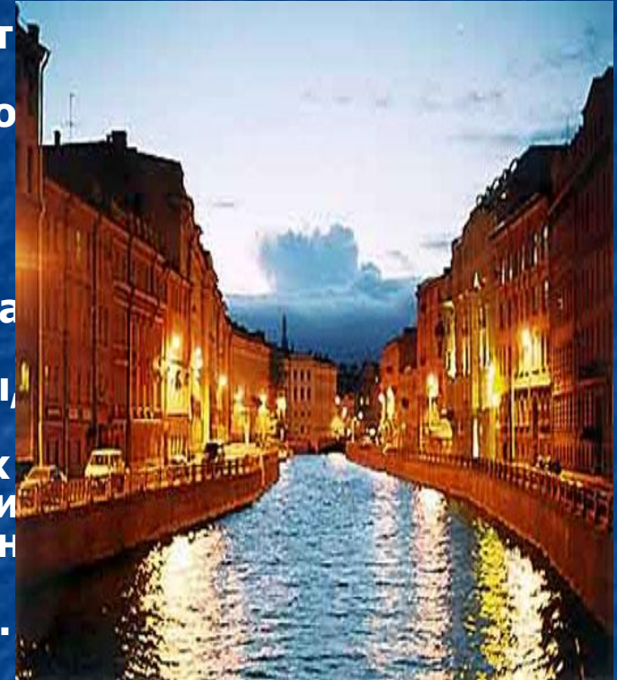
Санкт-Петербург, набережная реки Мойки