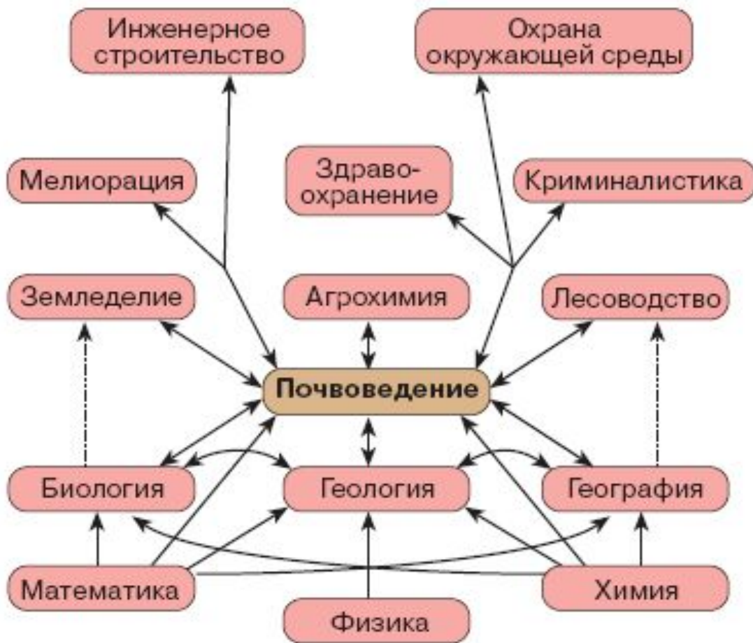
Рис. 2. Место почвоведения в системе наук