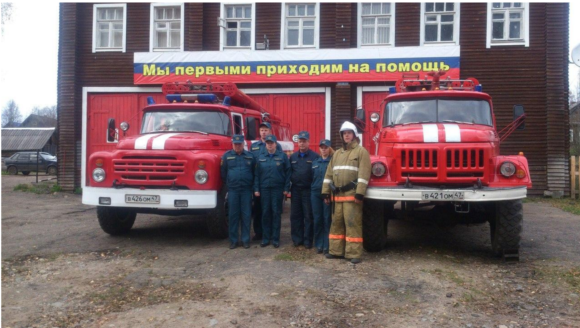
Здание 141 пожарной части с. Винницы и дежурный караул