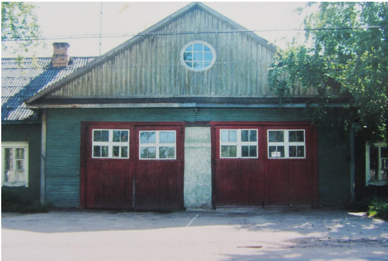
Вознесенская пожарная часть