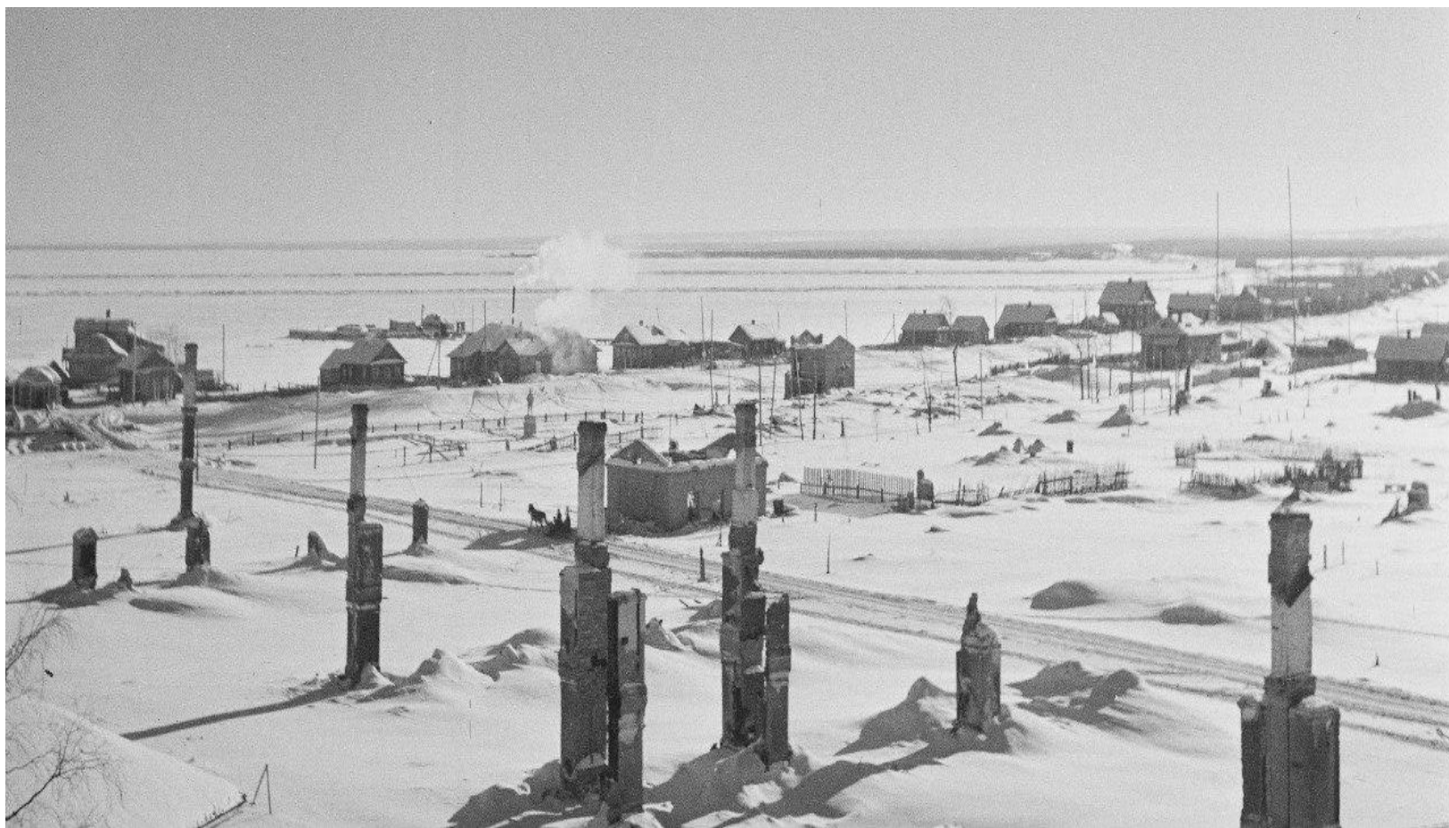
п. Вознесенье. Послевоенное время