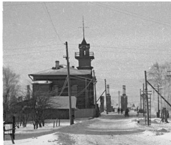
п. Вознесенье. Пожарная часть (февраль 1942 г)