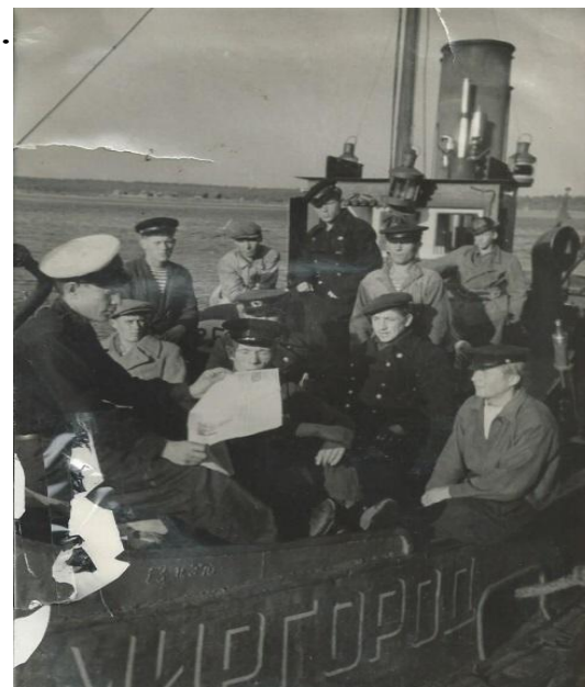
20.08.1948 г. Во время политзанятий.