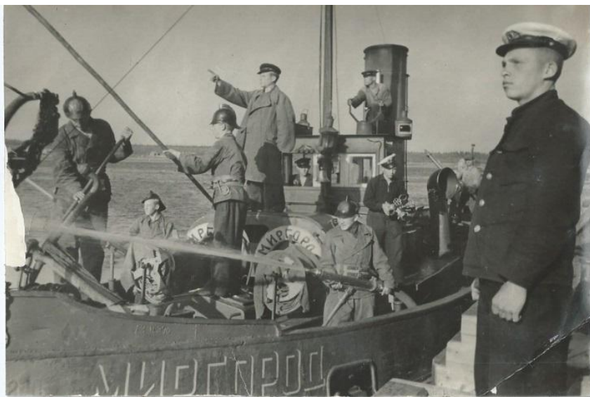
20.08.1948 г. Занятия боевого расчета.

Зимой 1954 года работы по благоустройству здания были закончены. Бойцы ВОХРА (вооруженная охрана) пожарного парохода дежурили вместе с пожарной командой, так как само судно было поставлено на зимовку. В пожарную часть дали еще машину ПМЗ-11-автоцистерна на шасси автобуса ЗИС.