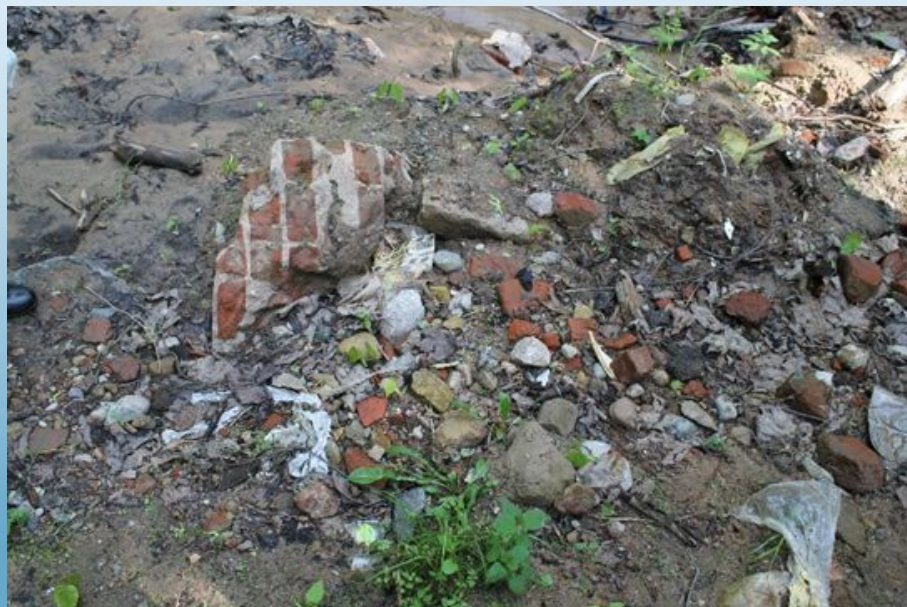
Останки старой церкви