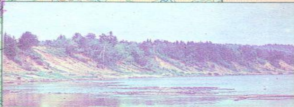
Коренной берег реки Вятки