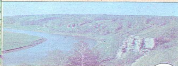
Утес на реке Немде