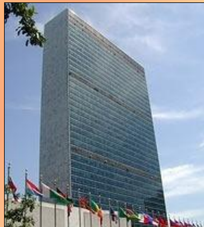
Штаб-квартира ООН в Нью-Йорке

К 2007 году в состав ООН входило 192 государство.