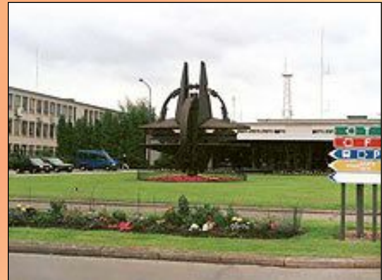
Штаб-квартира НАТО в Брюсселе