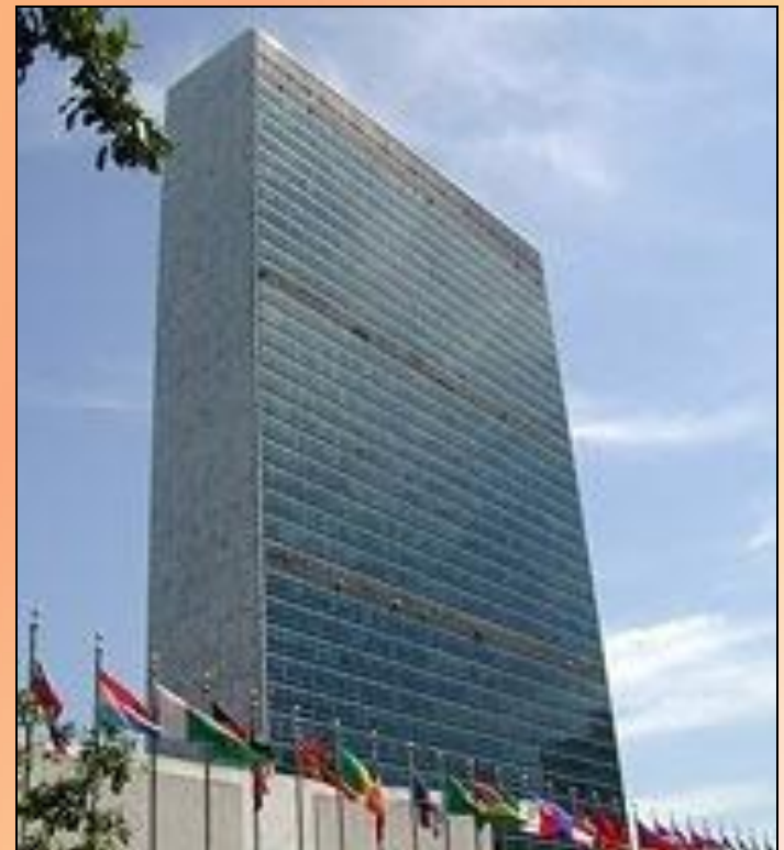
Штаб-квартира ООН в Нью-Йорке

К 2007 году в состав ООН входило 192 государство.