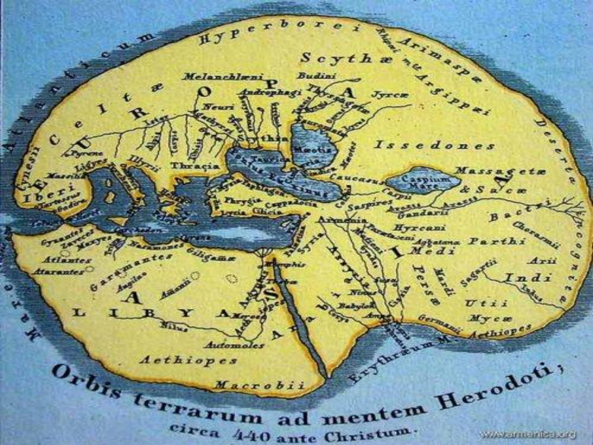
Orbis terrarum ad mentem Herodoti; circa 440 ante Christum.