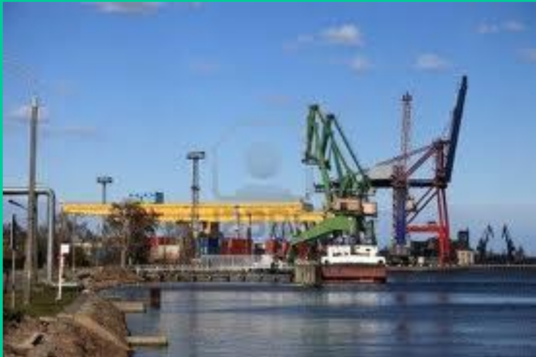
Port w Gdańsku