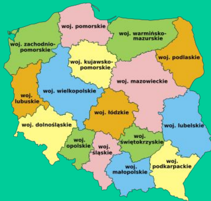
Obecny podział terytorialny Polski - województwa