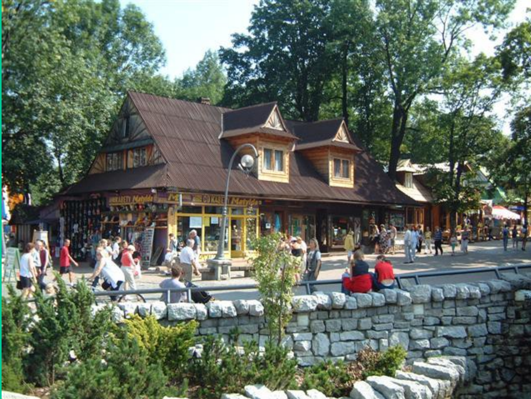
Zakopane – deptak na Krupówkach