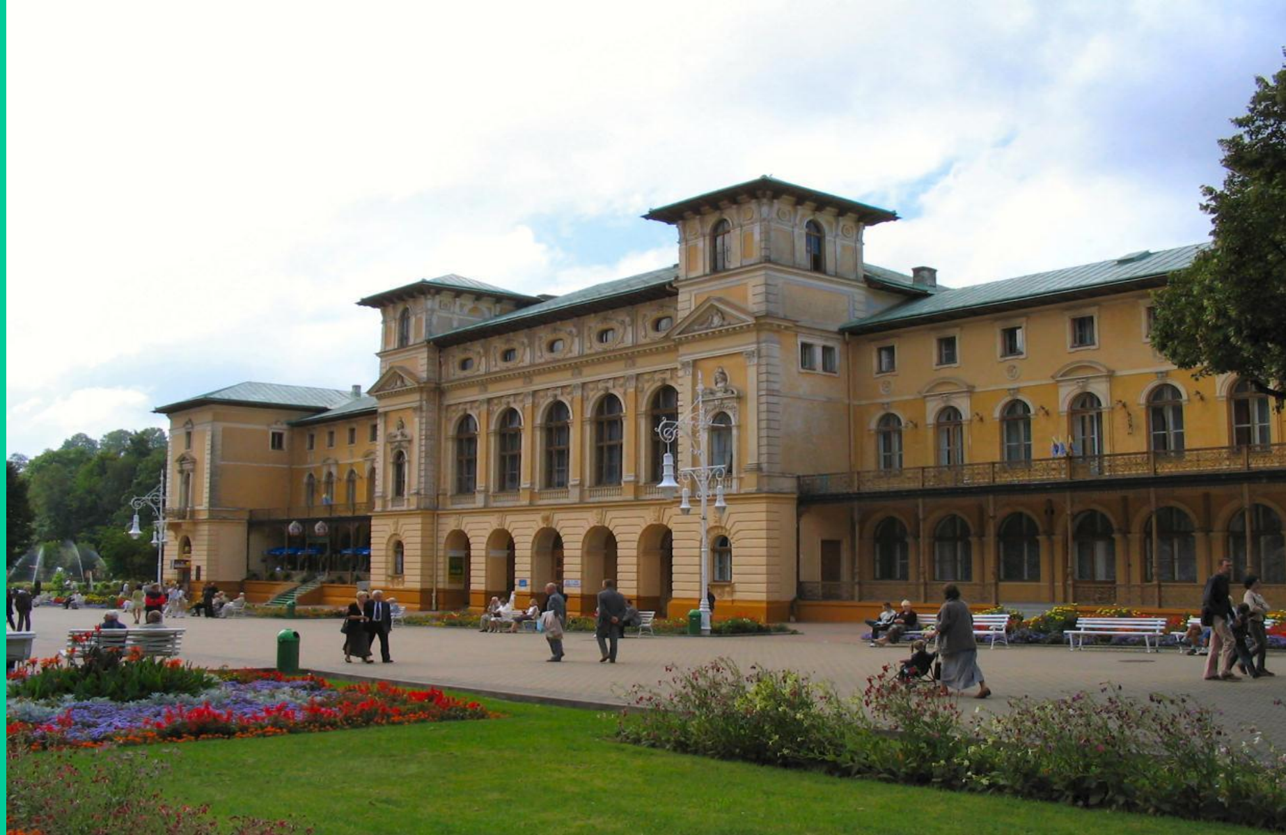
Uzdrowisko w Krynicy Zdrój – Beskid Sądecki