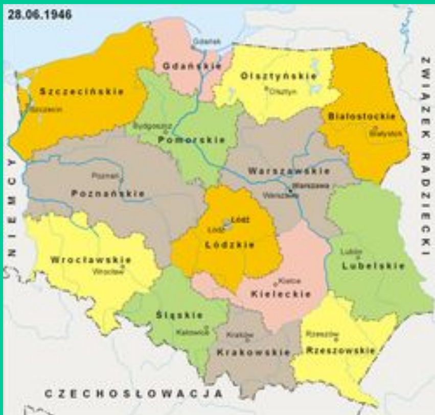
Województwa w Polsce - 1946 rok