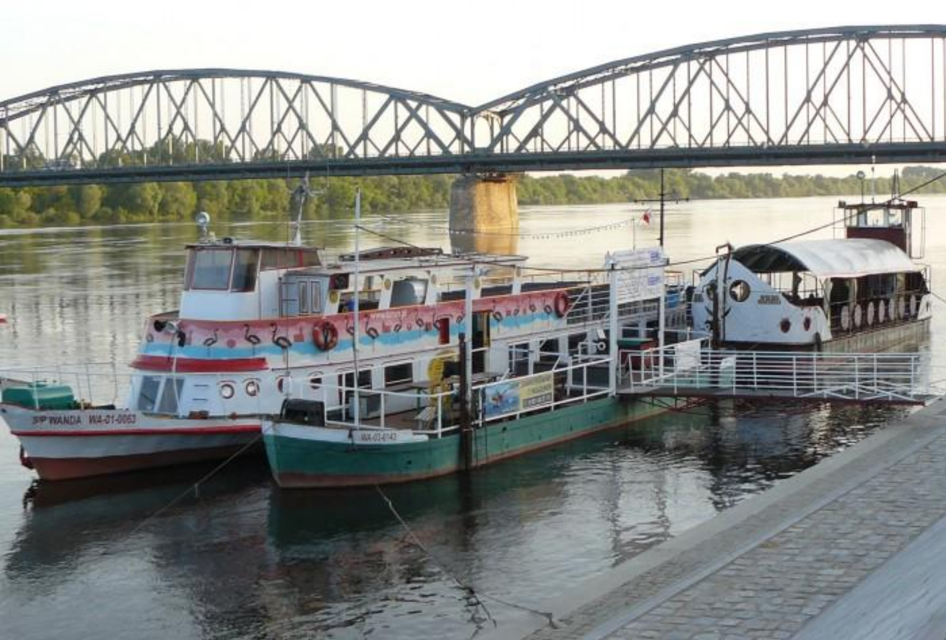
Statki na Wiśle