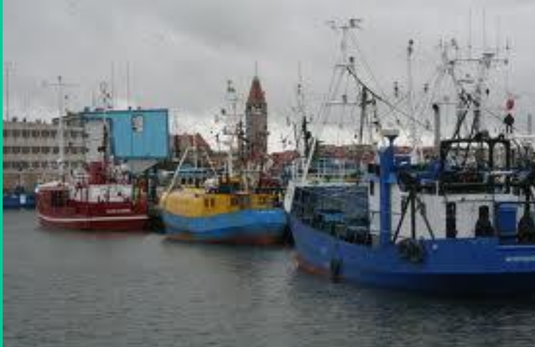
Kutry rybackie - Władysławowo