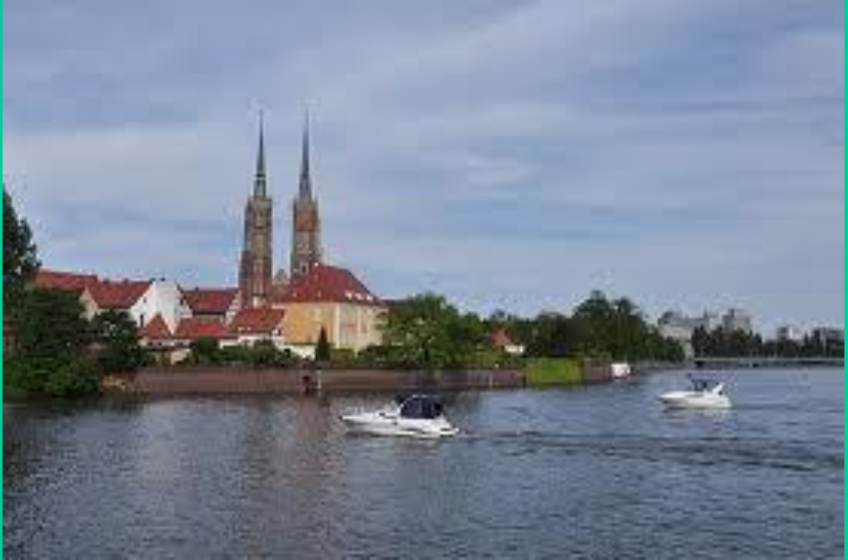
Wrocław nad Odrą