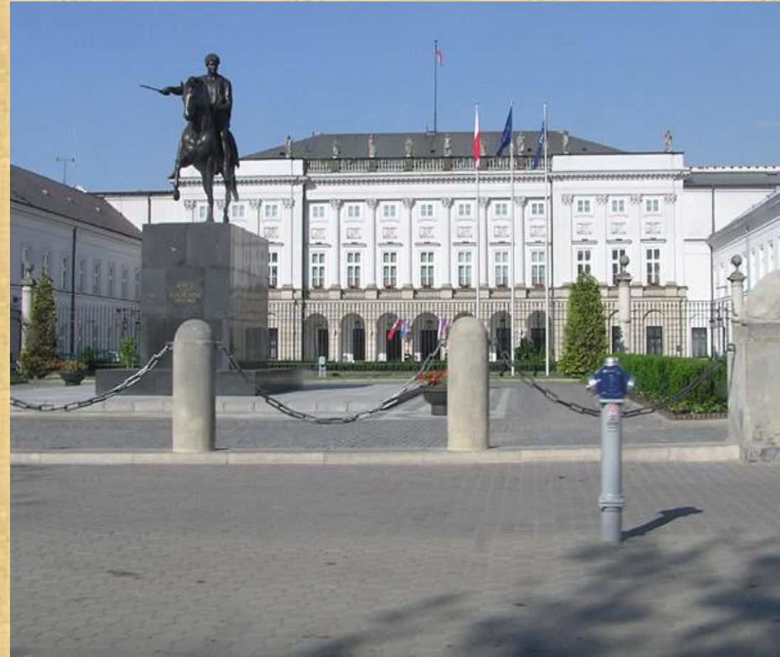
Резиденция президента республики Польши.