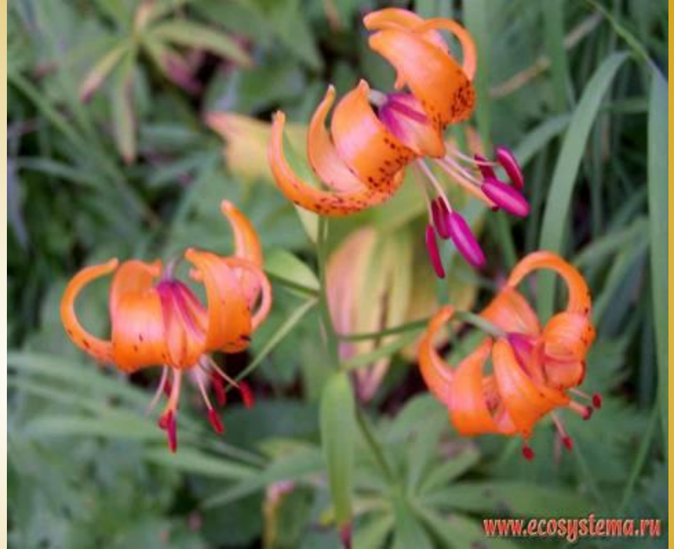
Лилия кудреватая, или саранка, бадун, царские кудри, маслянка ( Lilium martagon L.)