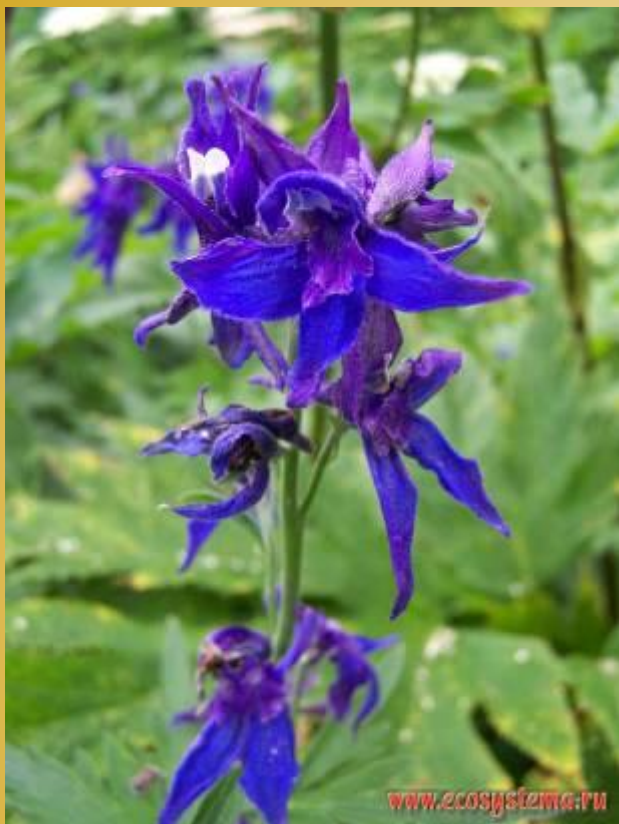
Живокость, или дельфиниум, шпорник ( Delphinium sp.)