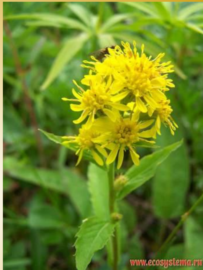
Бузульник ( Ligularia sp.)