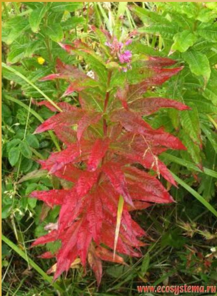
Иван-чай узколистный ( Chamaenerion angustifolium (L.) Moench.). Тихоокеанское побережье, Халактырский пляж