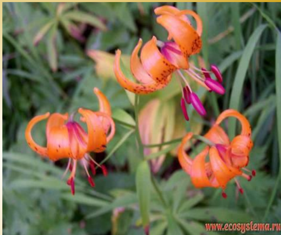
Лилия кудреватая, или саранка, бадун, царские кудри, маслянка ( Lilium martagon L.)