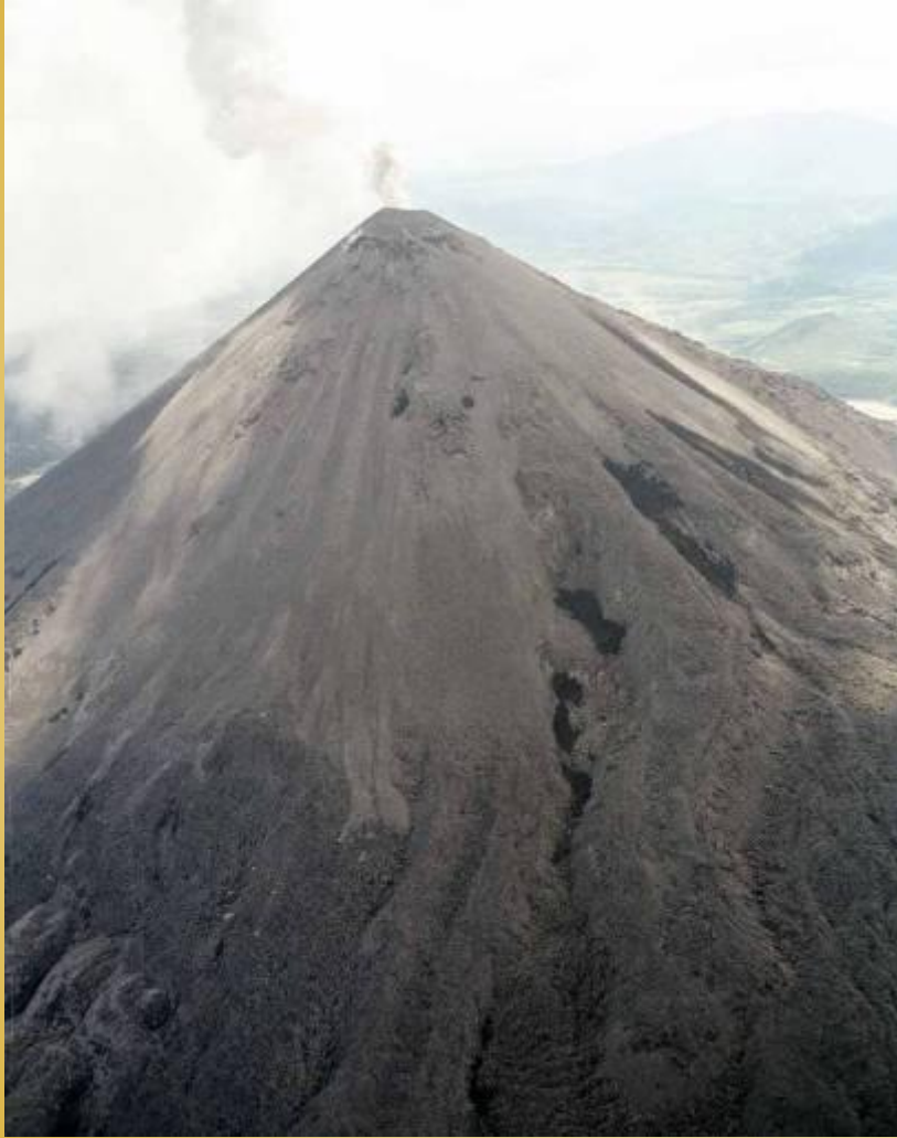
Вулкан Карымский (1536 м)