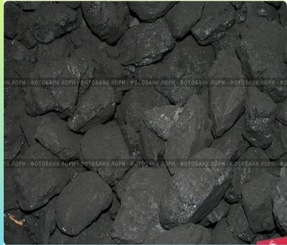
Органического происхождения (каменный уголь)