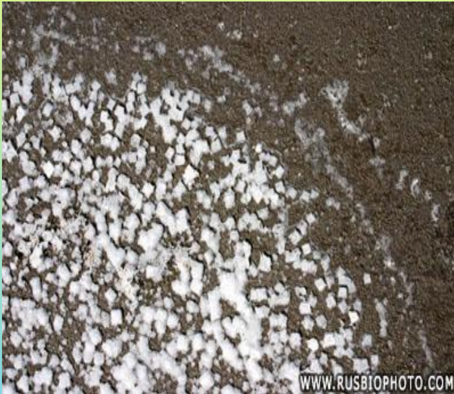
Химического происхождения (поваренная соль)