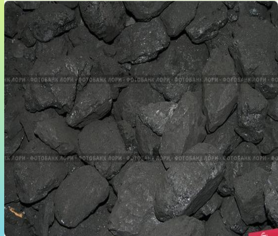
Органического происхождения (каменный уголь)