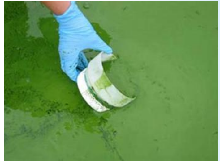
Загрязнение воды Волги