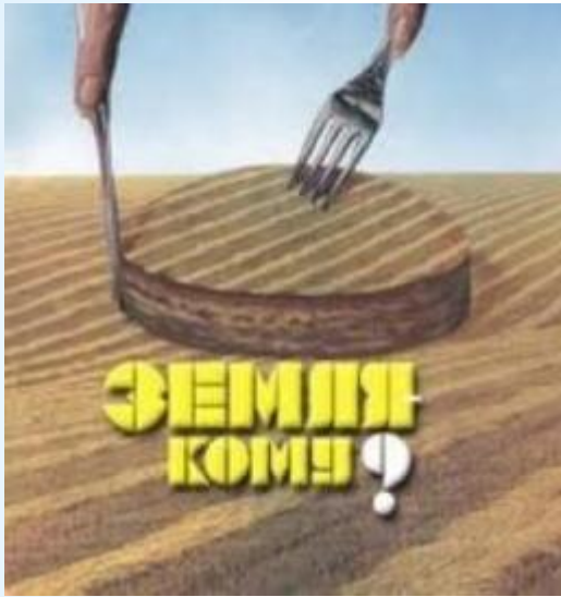
Чрезмерная распаханность земельных угодий