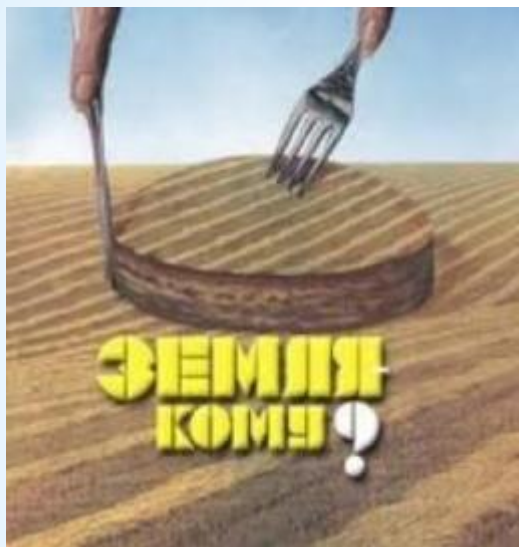
Чрезмерная распаханность земельных угодий