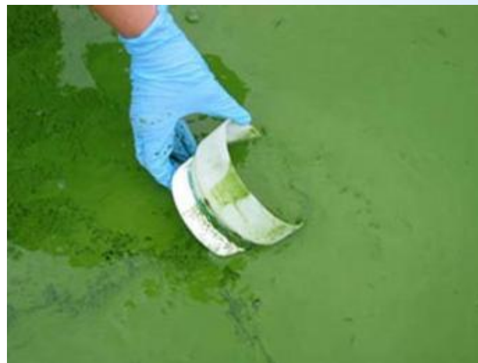
Загрязнение воды Волги