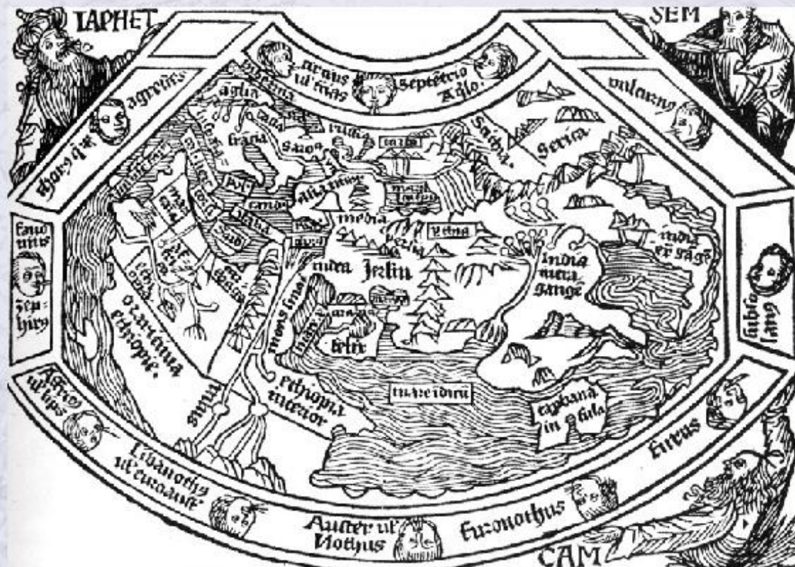
Земля по представлению Птолемея.

Слово география буквально означает «землеописание», так как первые географы описывали и зарисовывали то, что видели в экспедициях. Поэтому веками в географии господствовал описательный метод.