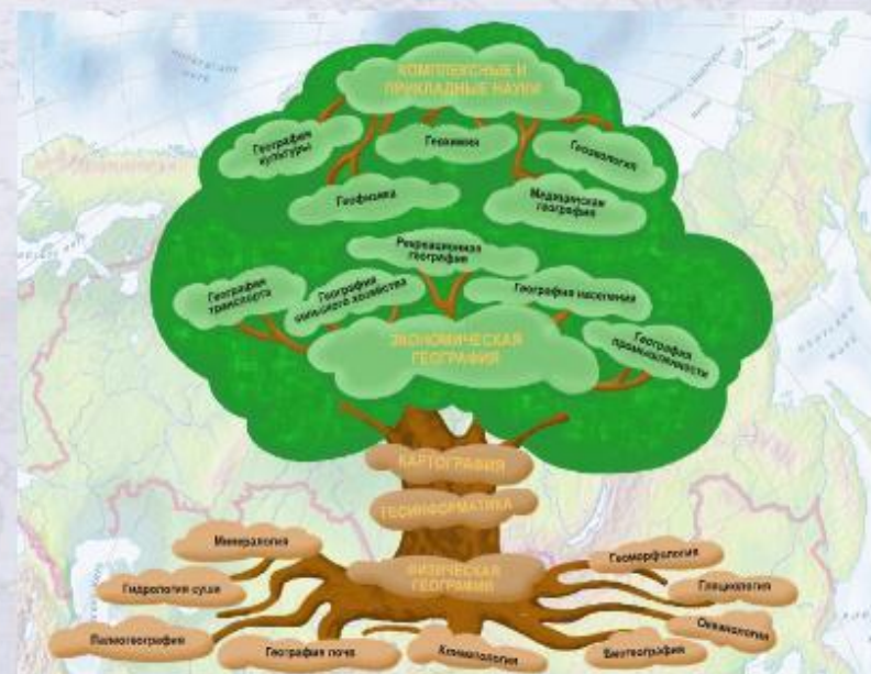
Древо географических наук (интерактивная схема).

Итак, социальная и экономическая география - общественная наука, изучающая территориальную организацию жизни человеческого общества в конкретных исторических и социальных условиях.