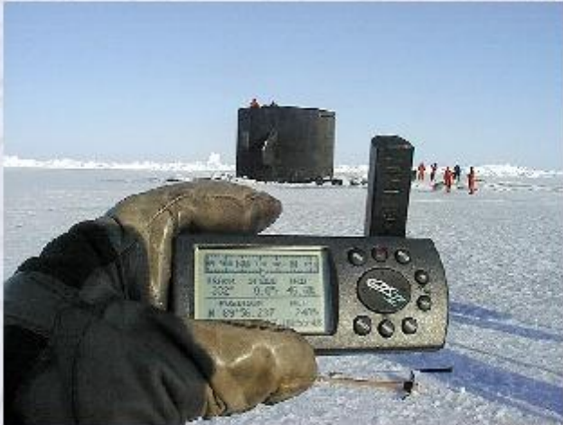
Приёмник системы GPS.