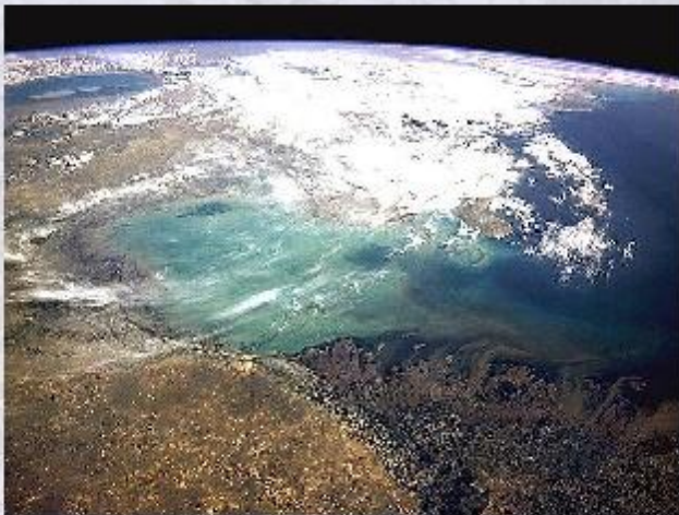
Дельта реки Волги (фотография со спутника).

Для решения сложных современных географических задач сегодня применяются геофизические и геохимические методы, аэрофотосъёмка местности. Появились математические и космические методы исследования (например, фотосъёмка из космоса, система глобального позиционирования GPS), географический прогноз. В последнее время возникло новое направление географической науки - геоинформатика .