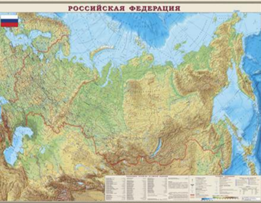
Физическая карта России (интерактивная карта).

География - очень древняя фундаментальная наука. Она возникла ещё в те незапамятные времена, когда человечество только начинало открывать и осваивать новые территории. Активное развитие география получила в античных обществах: хорошо известно, что географическими исследованиями занимались многие древнегреческие философы.