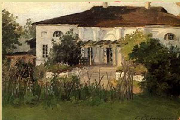
С.П. Кувшинникова, 1892