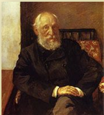
Портрет Н.П. Панафидина И.И.Левитан