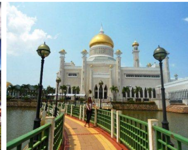
Бандар-Сери-Бегаван (Bandar Seri Begawan)

Бандар-Сери-Бегаван с населением в 140 000 человек является столицей и самым крупным городом султаната Бруней в Юго-Восточной Азии. Главными туристическими достопримечательностями этого города являются Мечеть Султана Омара Али Сайфуддина, Королевский Зал Торжеств, Королевский Мавзолей и Музей Брунея.