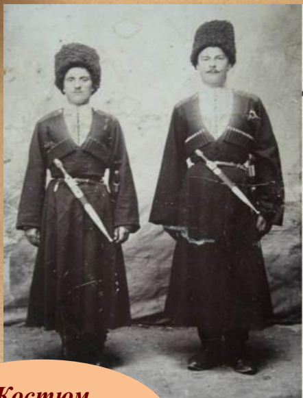
Костюм кубанского казака