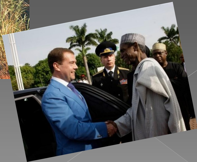
Нигерия, г. Локоджа, октябрь 1993г.