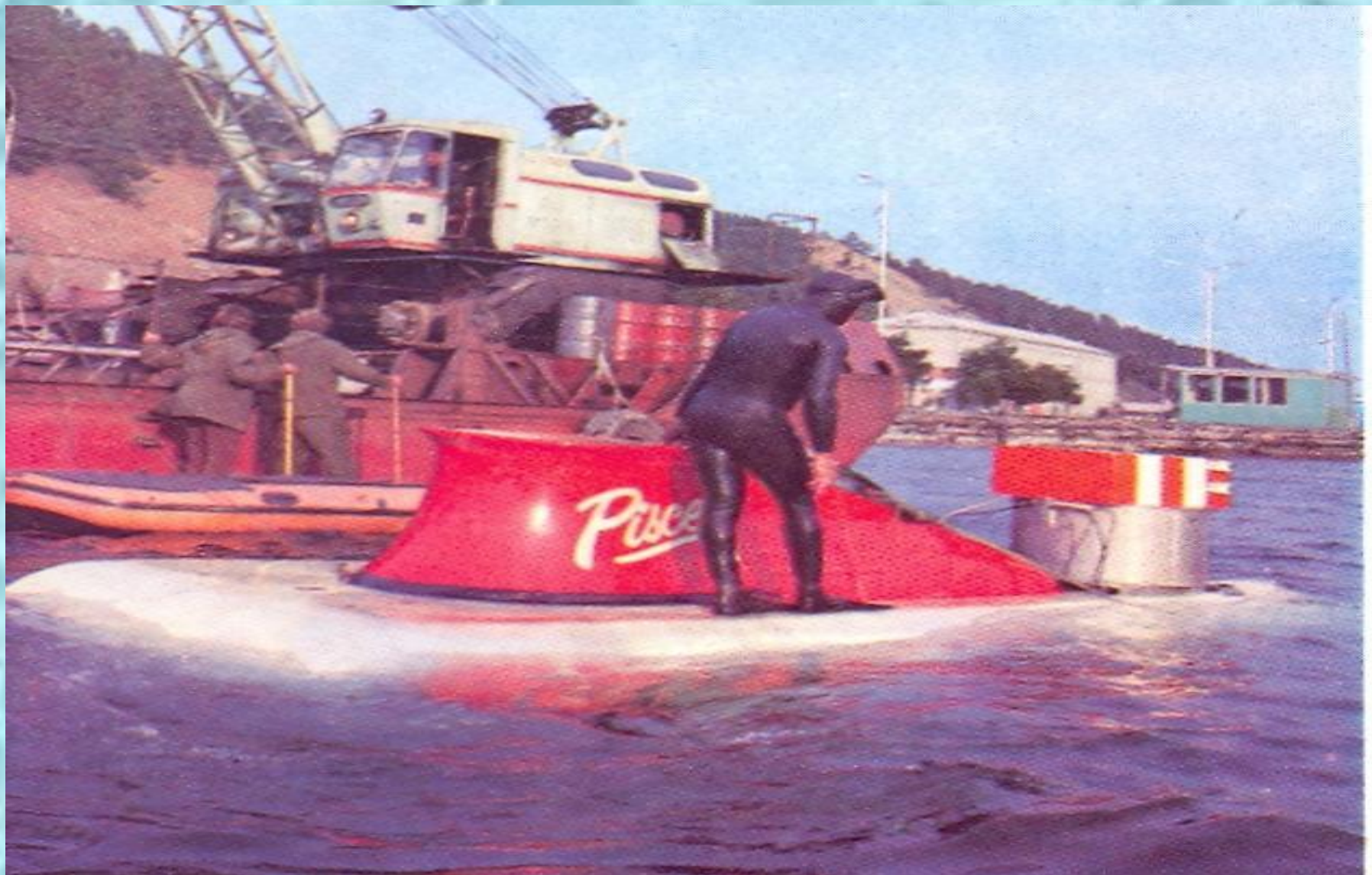
Подводный аппарат «Пайсис»