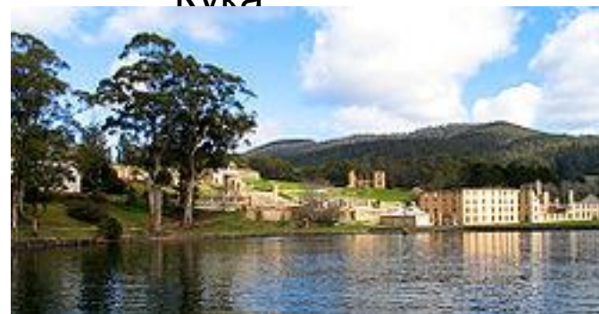
Порт-Артур на Тасмании был крупнейшей пересыльной базой преступников.