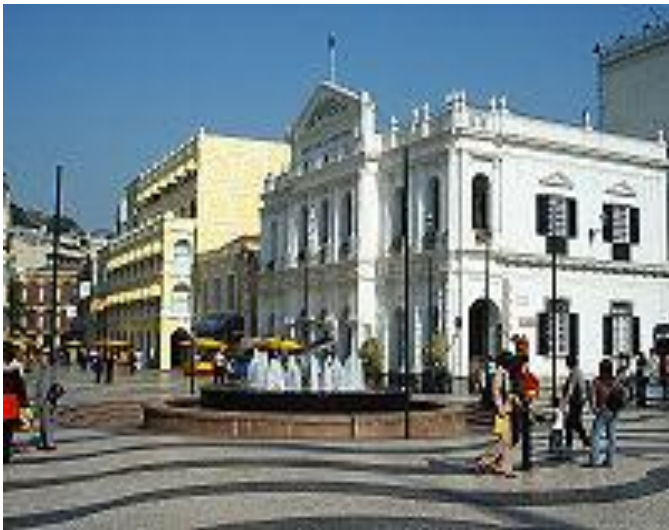
Исторический центр Макао