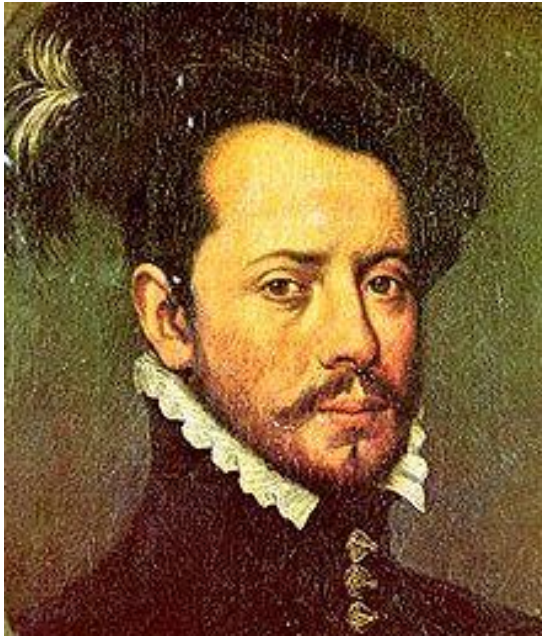
Эрнан Кортес- покоритель ацтеков

❖ Центром колонизации стал остров Эспаньола (Гаити).