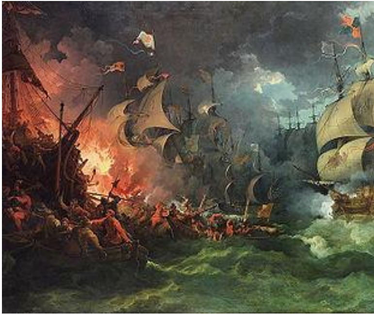
Гибель «Непобедимой Армады»