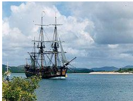
Копия корабля Д. Кук