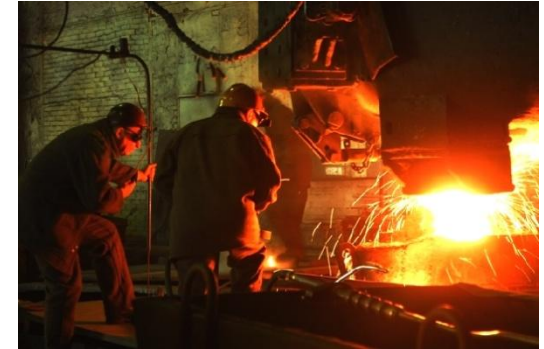
чёрная и цветная металлургия