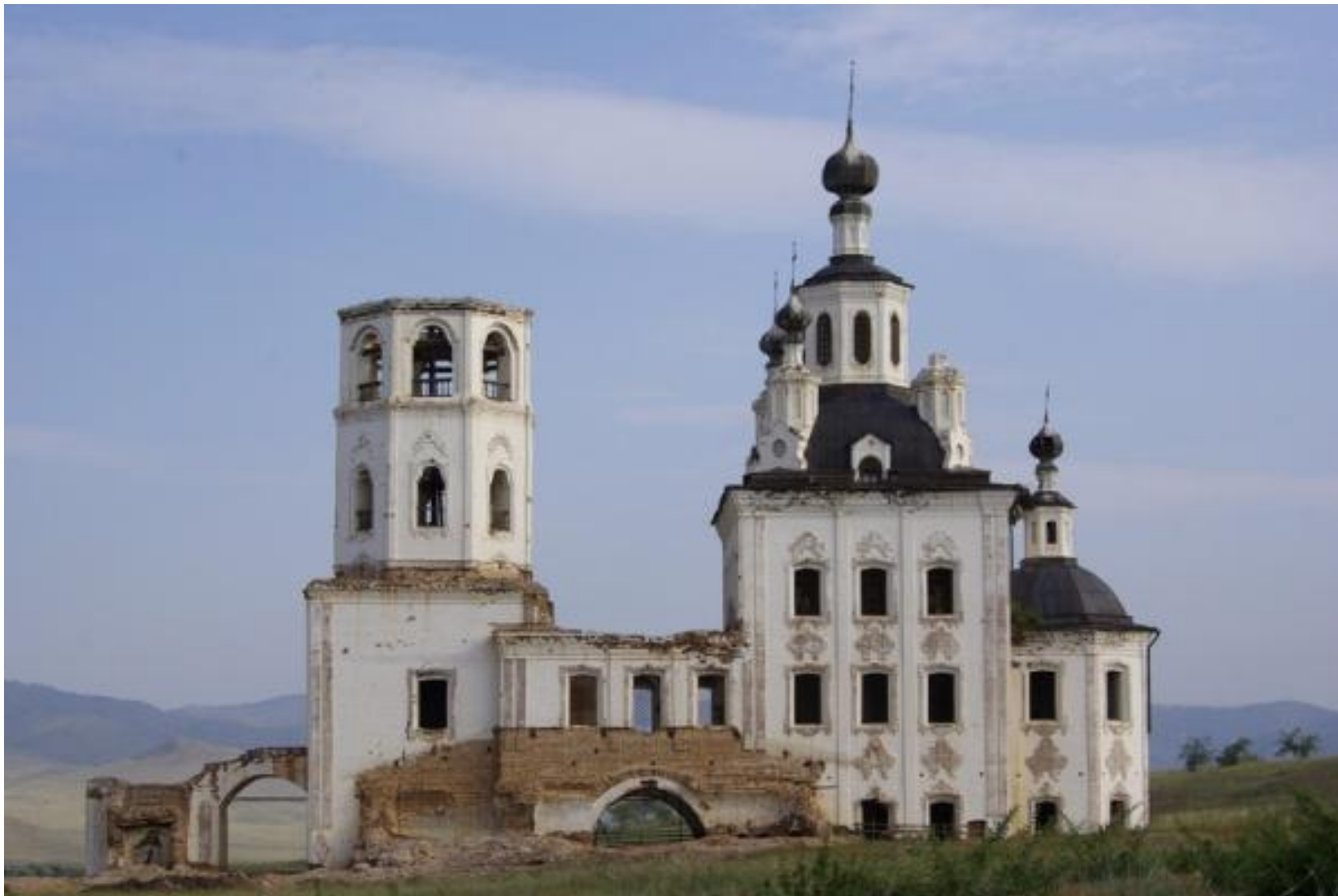
Собор Спаса Преображения