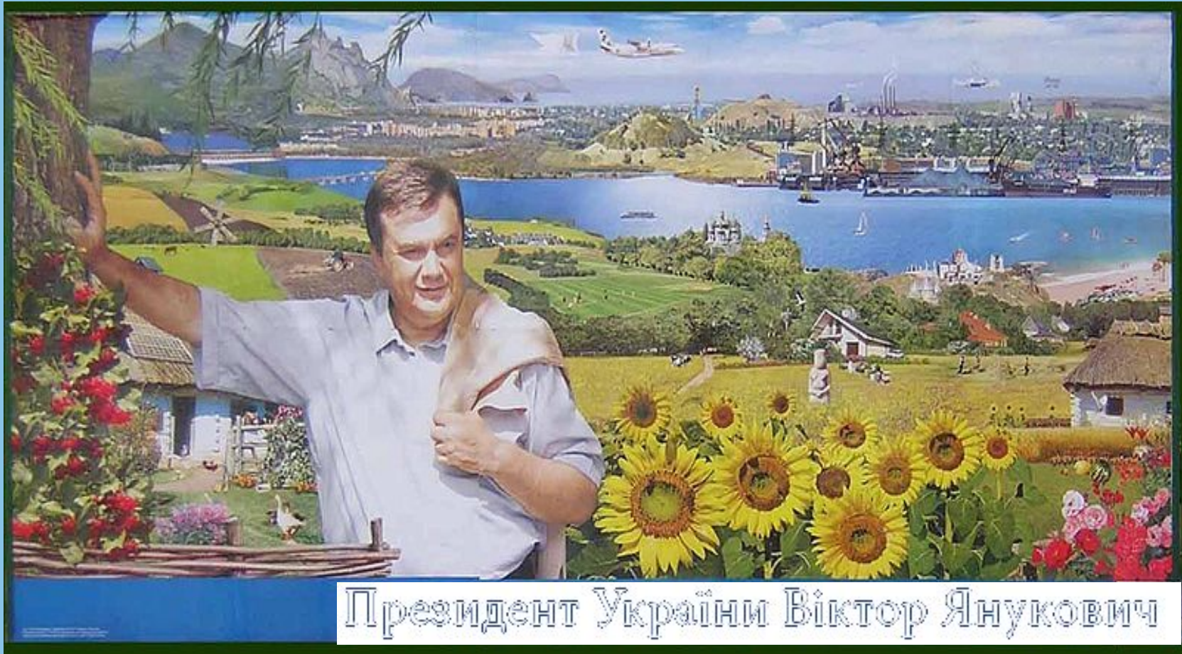
Президент України Віктор Янукович