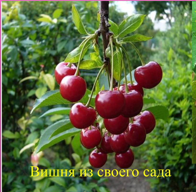
Вишня из своего сада