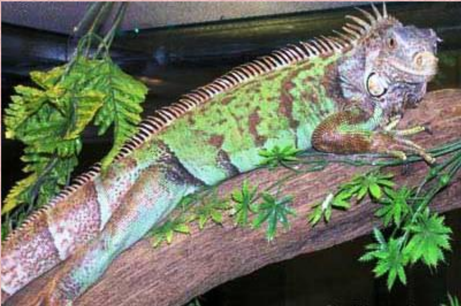
Реликтовая ящерица - игуана